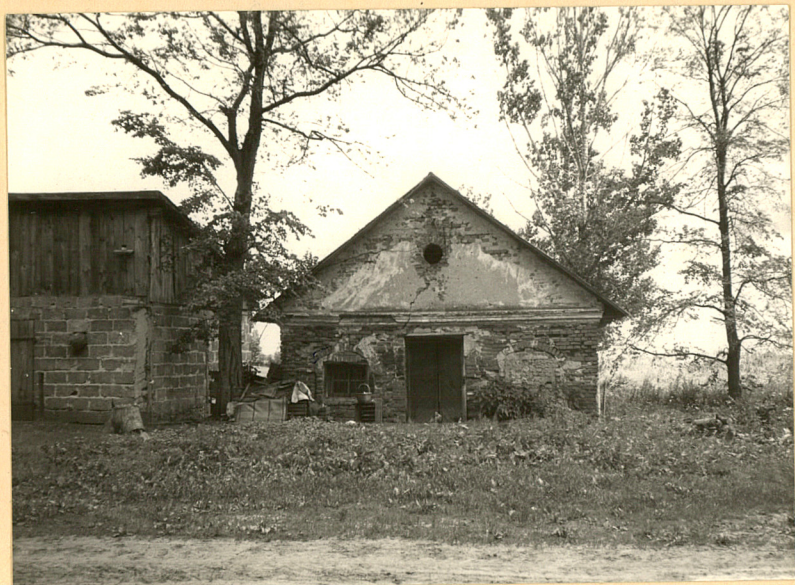
3. Elewacja zach.