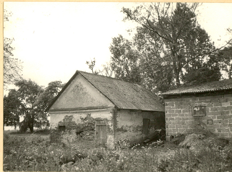
4. Elewacja wsch.