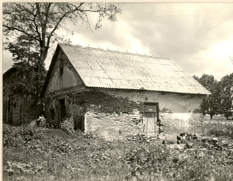
2. Elewacja pld.-zach.

data wykonania czerwiec 1988r miejsce przechowywania negatywów w posiadaniu autora