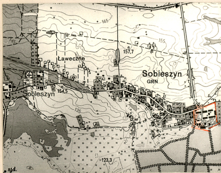
1. Orientacja 1:25000