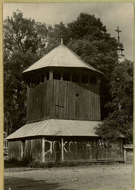
TZG Chełmno — Nr 495 9, 50 40.000 B-119479

Otoczona wraz z dworami i drewnianym ogrodzeniem. Orientowana, konstrukcji szkieletowej na podmurówce ceglanej, trójdzielna, prezbiterium kamiennie trójbożnicze, przy nim od pśd. i pśn. dwie kwadratowe lokalności mieszkalne i stajnie. Szersza nawa i babiniec kwadratowe. Górne kondygnacje wykorzystywane jako w kształcie osmiościennej bębni przykryte kopułami z latarniami. W kopułach sklepienia płaskie, w innych lokalnościach stropy. Polichromia wnętrza 1892 o tradycji barokowej. Dworonica. zbudowana na strop. dwukondygnacyjna, dachy kryte blachą. Figura przy drzwiach. Porządek kamienny w. Floniarska na czerwonoczerwonym posztumencie.