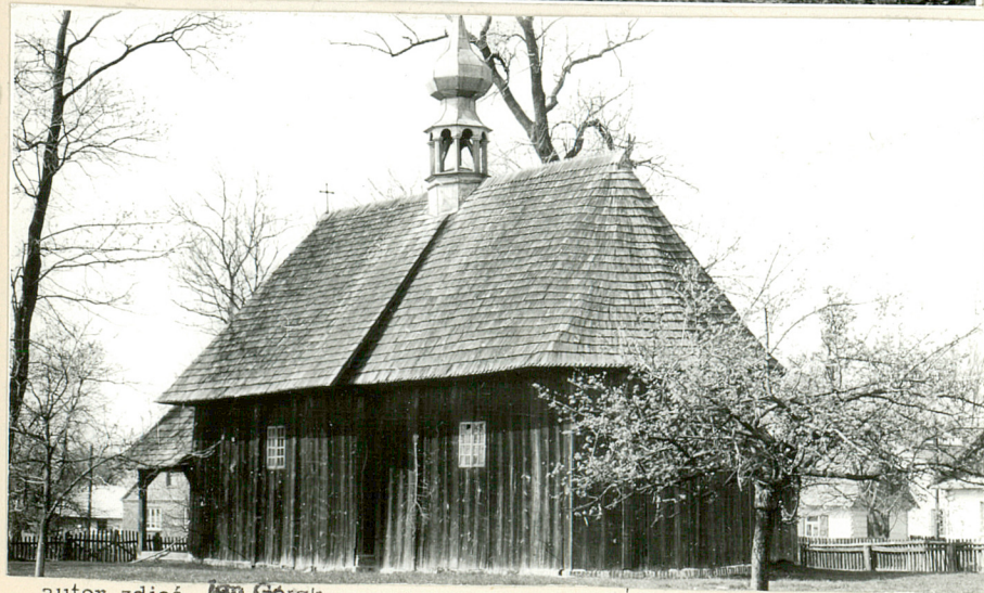
autor zdjęć Jan Gorak data wykonania 1984 miejsce przechowywania negatywów u aut.