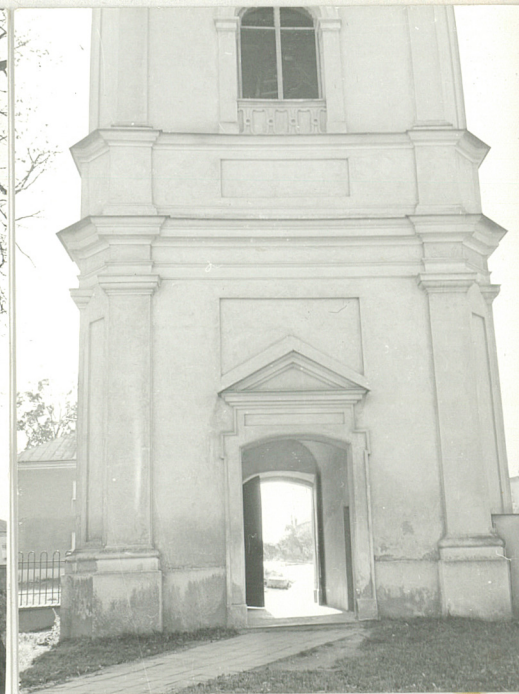
1. Widok ogólny od strony płd.-wsch,