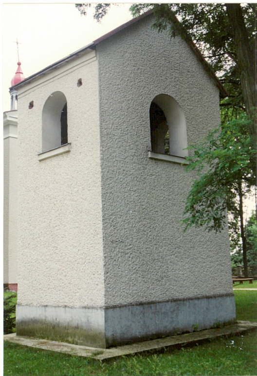
Widok od pñ.zach..