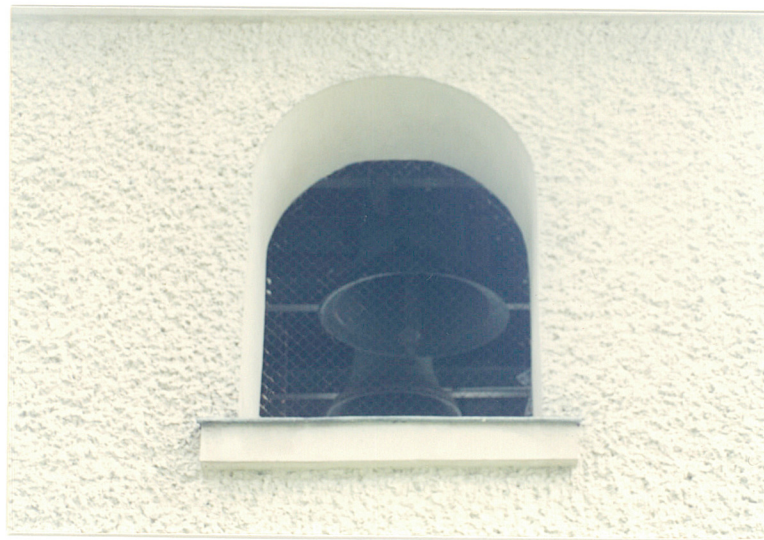
Okno elewacji bocznej