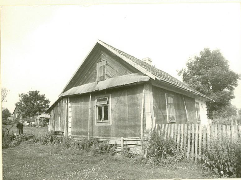
Widok od pn.-wsch.