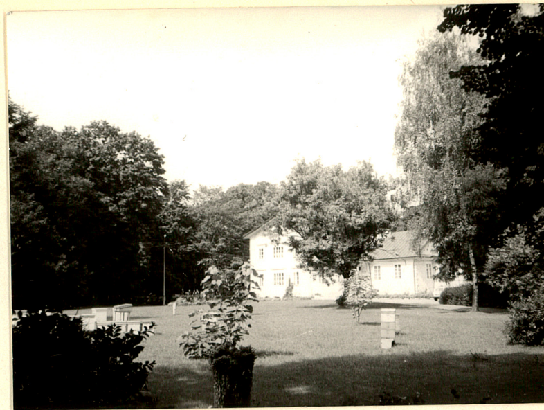
6. Centralna część parku, widok od strony pałacu.