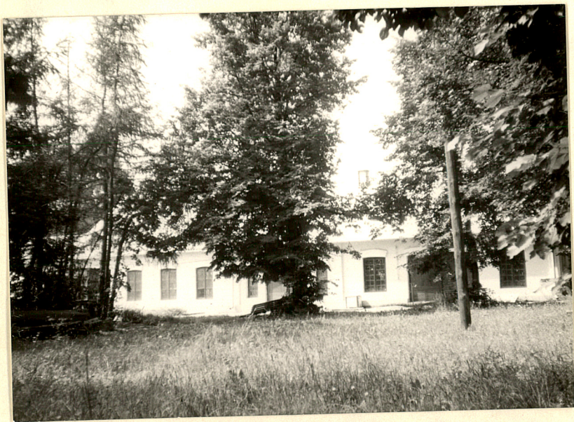
7. Fragment zabudowy folwarku.