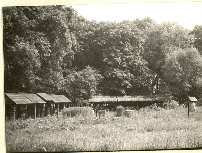
8. Skansen pszczelarski przed płn, elewacją pałacu.