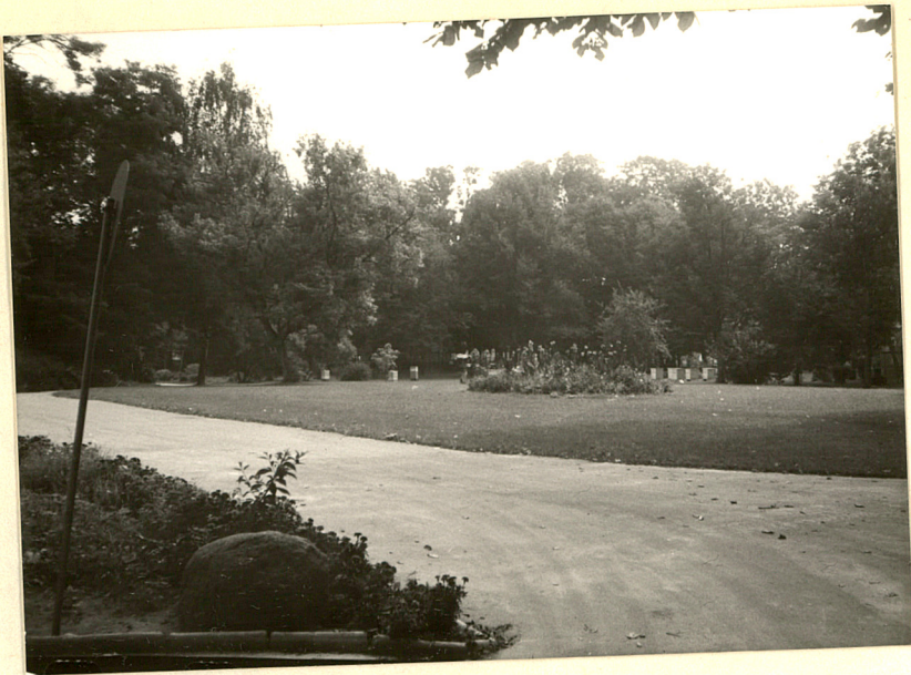
5. Widok pałacu od strony folwarku.