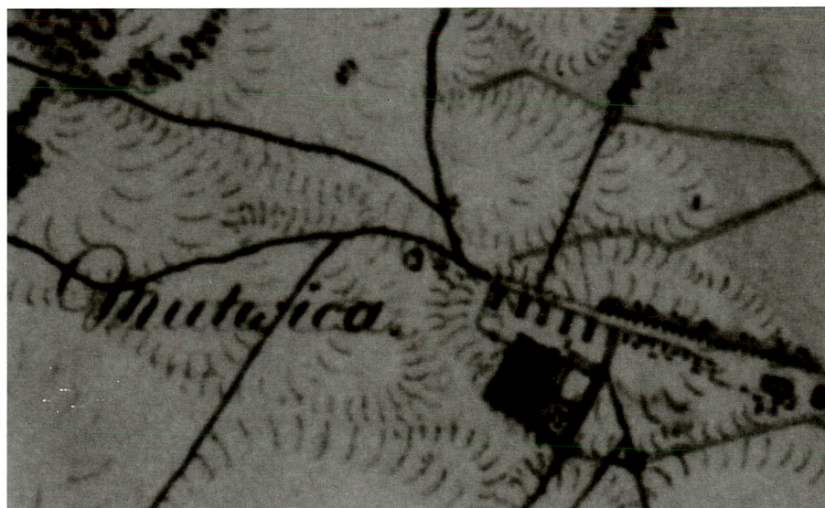
Fragment mapy zachodniej Galicji, A. Meyera von Heldensfelda,