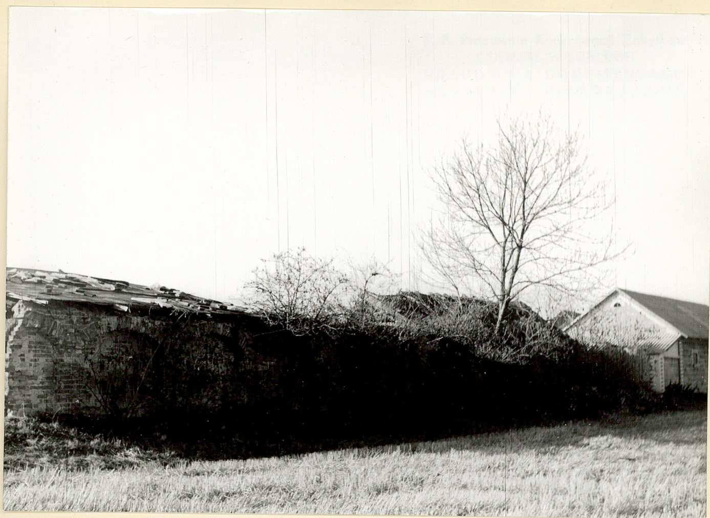
Fot.3-Turkowiec Wies.Mur d.oraazerii.