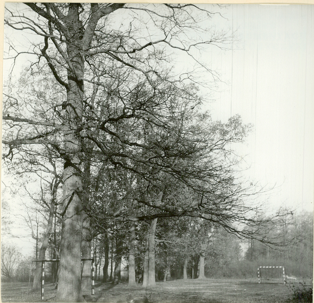
Pet.2-Turkowiec Zakład.Dęby przy zachodniej granicy zakładu.