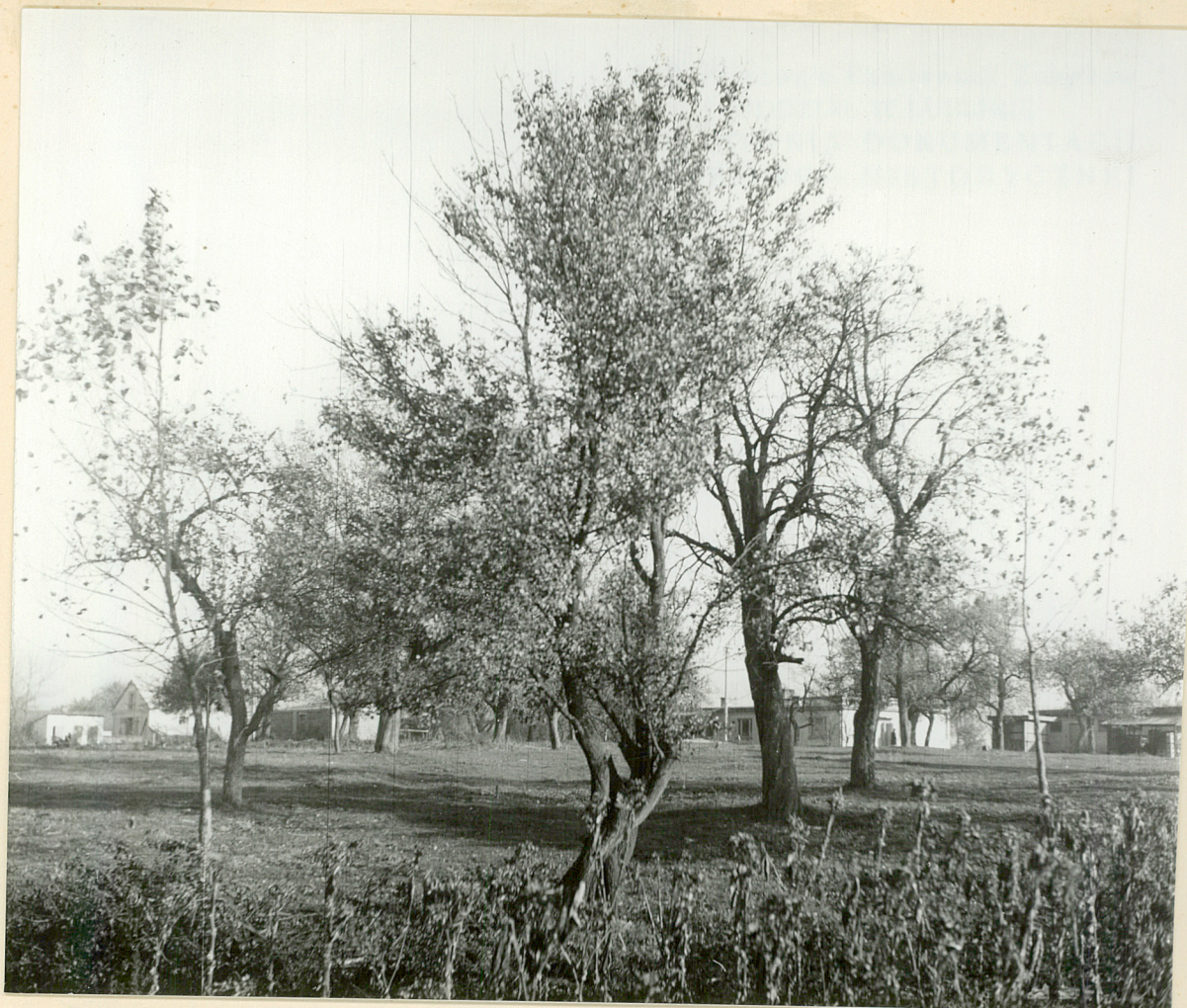
Pot.6-Turkowice Wica.Sad podwerski.