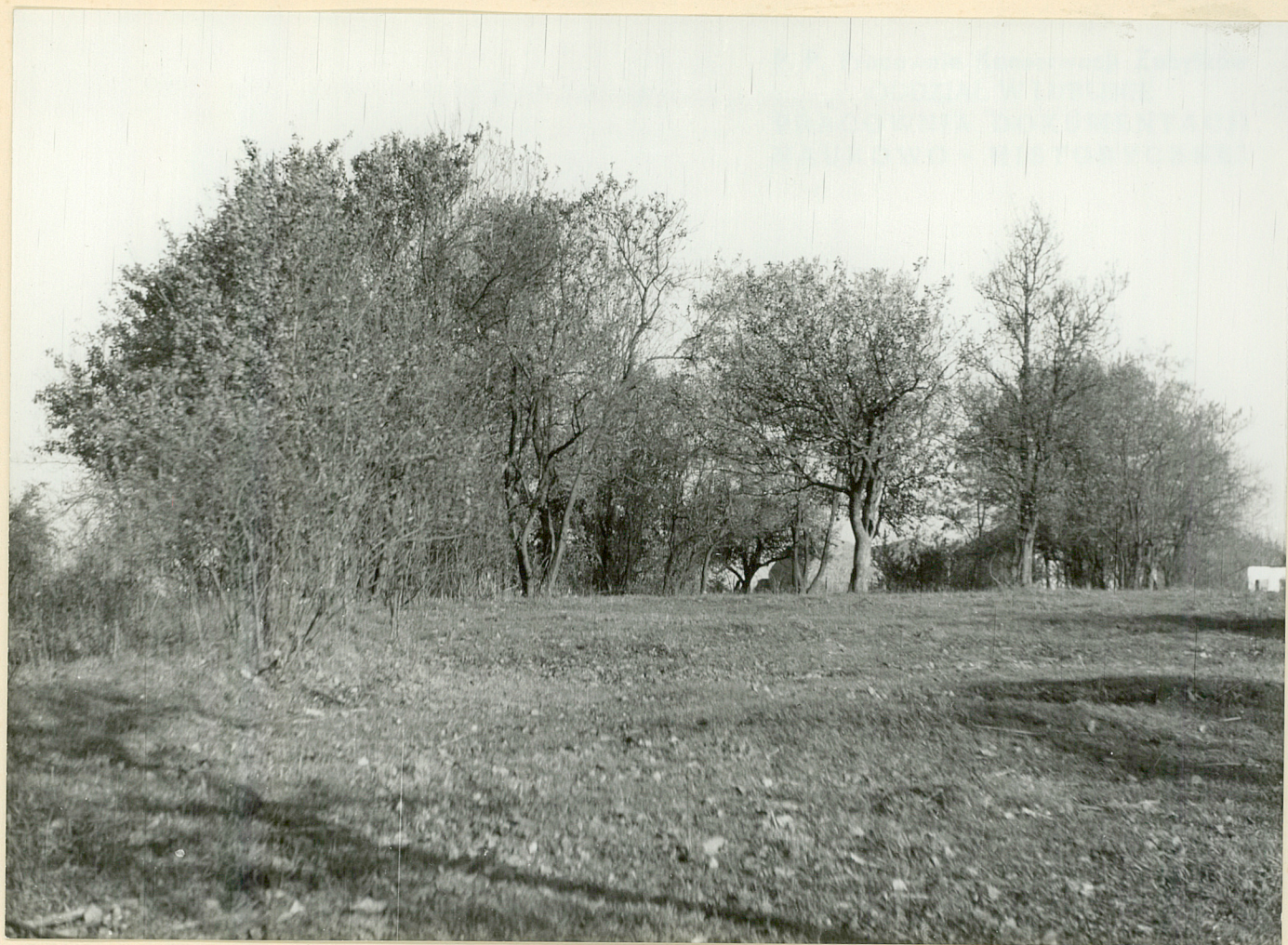
Pot.4-Turkowice Wies.Krzewy w miejscu d.aleii lipowej.