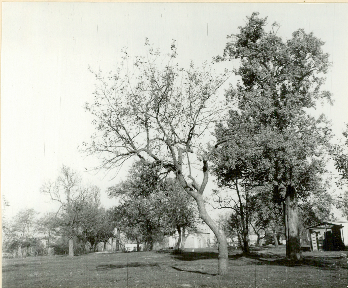
Fot.5-Turkowiec Wied.Sad podwerski-piękny okaz gruszy.