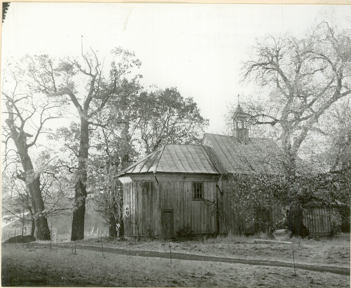
Dęby szypułkowe o \varnothing 80-100 przy drewnianym kościółku.