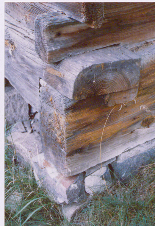
Podwalina i zwęgłowanie pld. narożnika