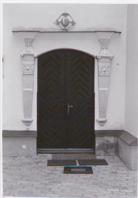
Manierystyczny portal w fasadzie