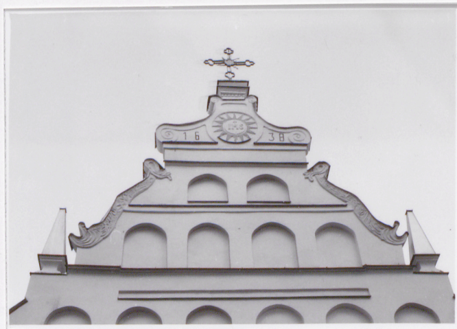
Dekoracja szczytu fasady.