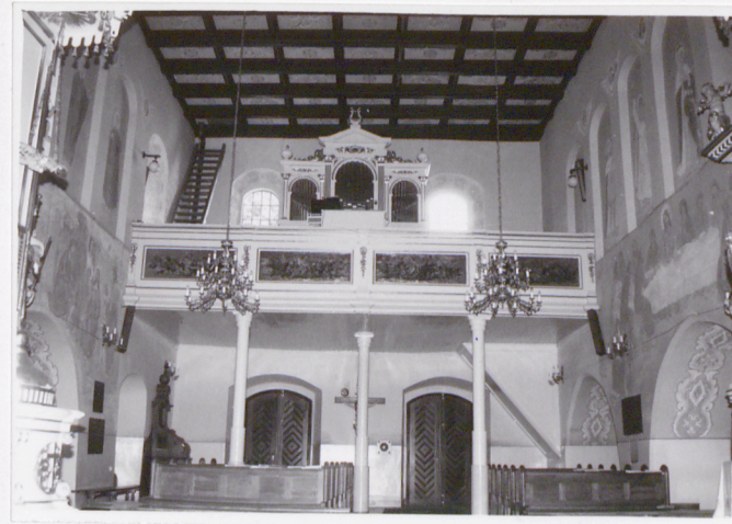
Widok na chór muzyczny