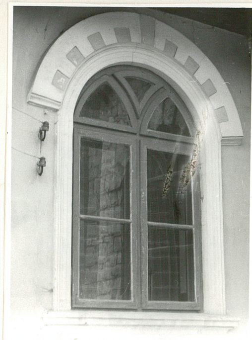
Okno na piętrze.