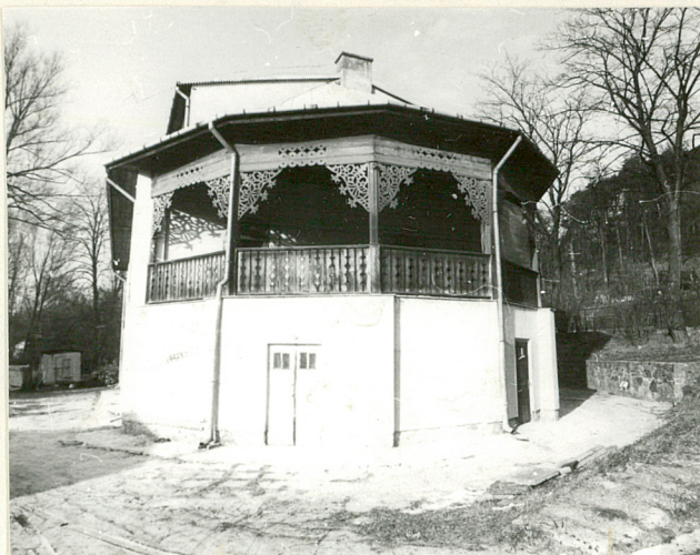
Widok str. wsch.