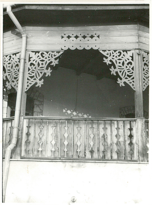
Fragm.balkonu od wsch.