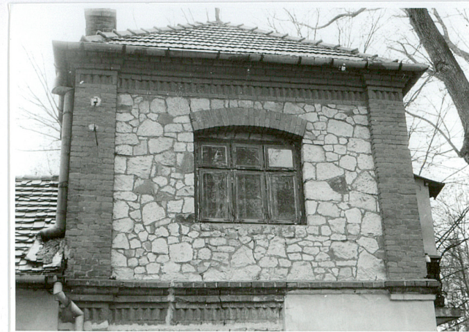
fragm. elewacji wsch. - piętro