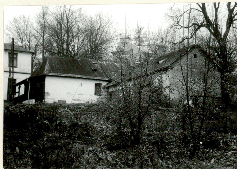
ELEWACJE PÓŁNOCNE OBU CZĘŚCI OFICYNY