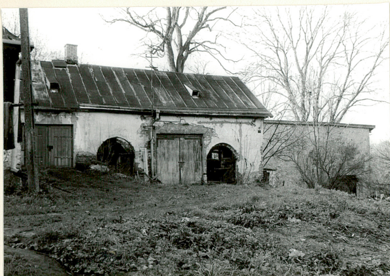
ELEWACJA WSCHODNIA CZĘŚCI GOSPODARCZEJ