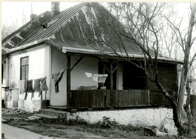
CZĘŚĆ MIESZKALNA - ELEWACJA WSCHODNIA

Instalacje - elektryczna, ogrzewanie piecowe, woda jest przynoszona ze studni.