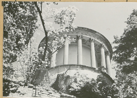
atyczny, uwagi opisowe, fotografia