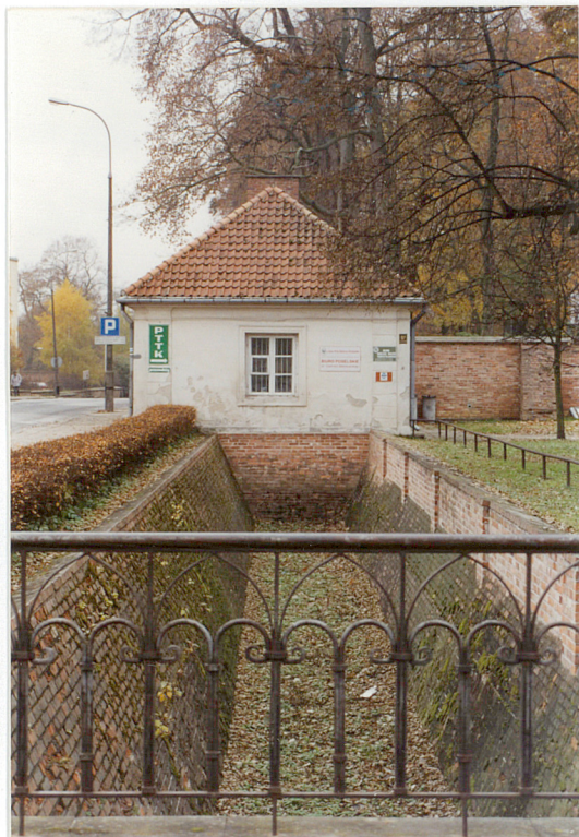
Fot.1 Widok na elewację pn.