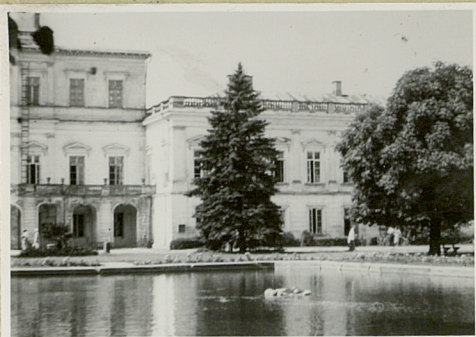
ny, uwagi opisowe, fotografia