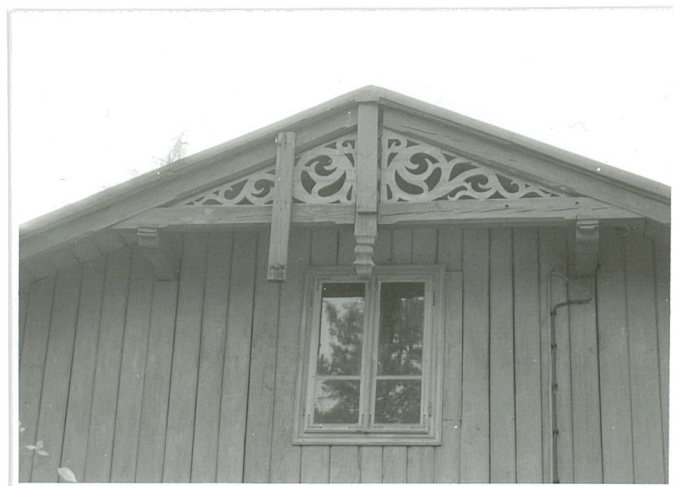
laubzegowa dekoracja szczytu