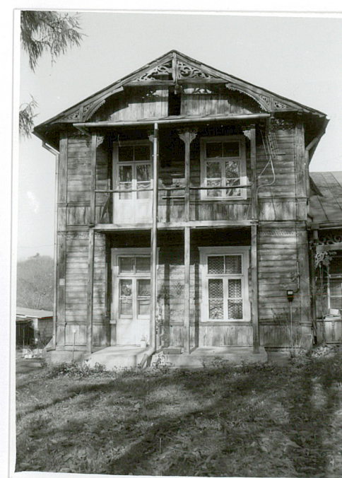
elewacja pd.- część piętrowa