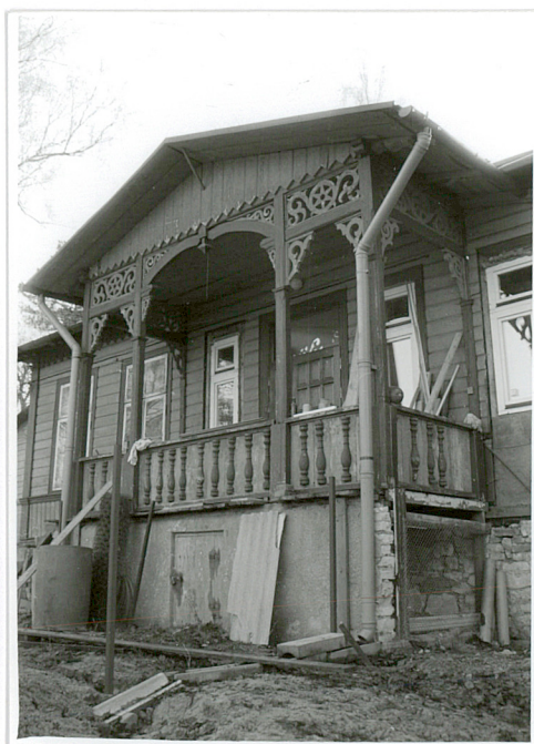
ganek w elewacji płn.