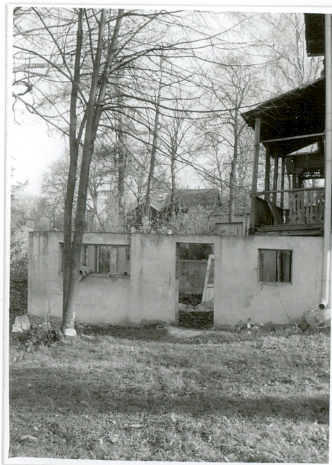
przyziemie nieukończonego tarasu