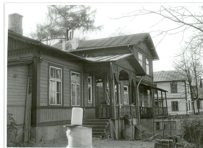
widok od płn.-wsch.