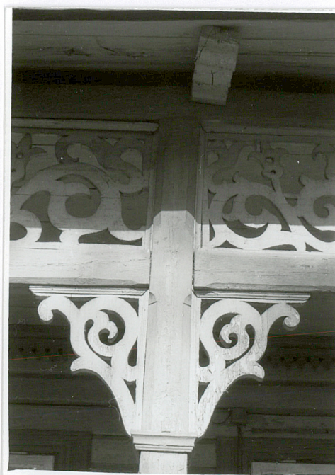
laubzegowa dekoracja tarasu elewacji pd.