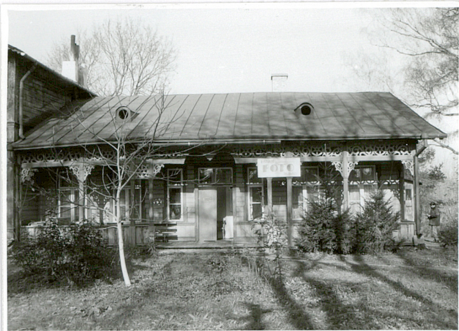
elewacja pd.-część parterrowa