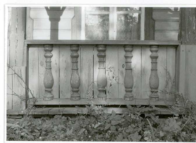
balustrada tarasu w elewacji pd.