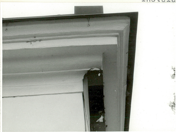
profilowany gzyms elewacji front. mgr J. Studziński, XI.1997 r.

Instalacje : elektryczna, wod.-kan., c.o., telefon.