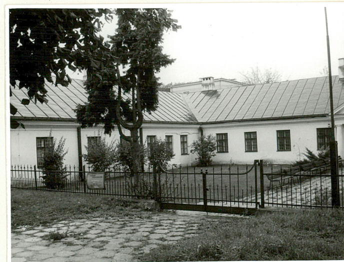
fragm. elewacji front. widok od pn.