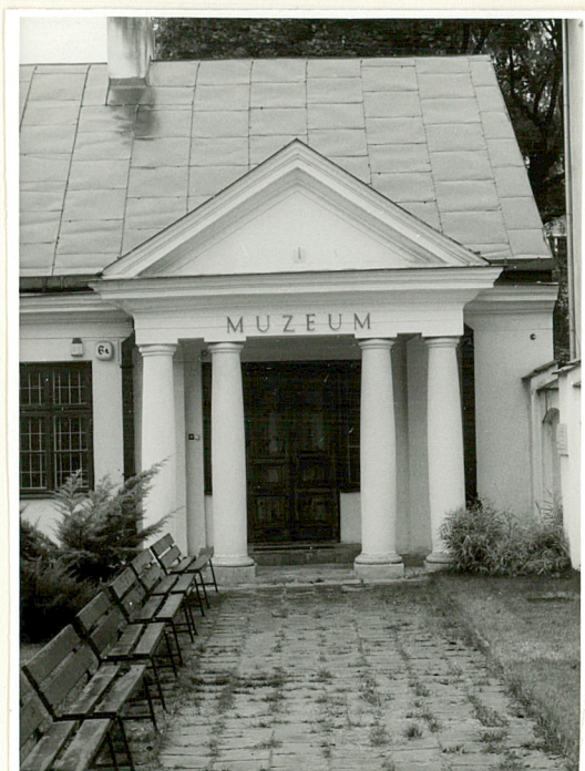
portyk w elewacji front.