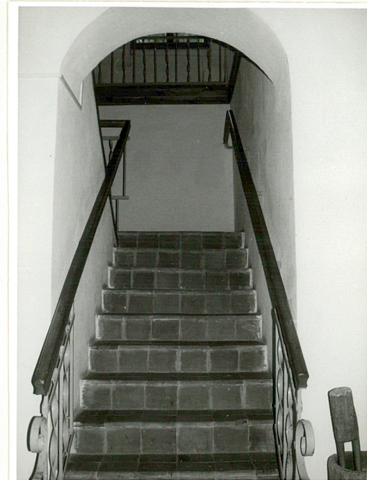
klatka schodowa w środkowej części budynku