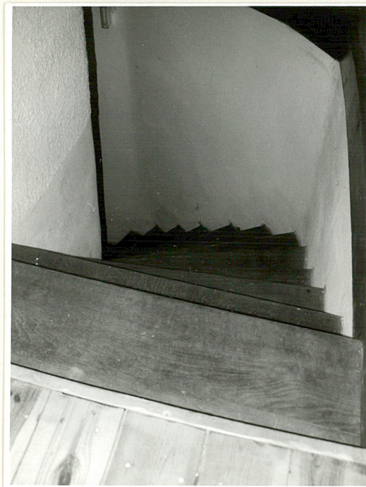
fragm. drewnianych schodów na poddasze