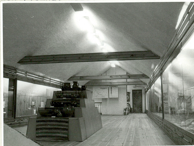
przebudowane wnętrze muzealne na poddaszu

Z-d Poligr. Jan Jasiński W-wa, ul. Wolna 13, tel. 12-43-83