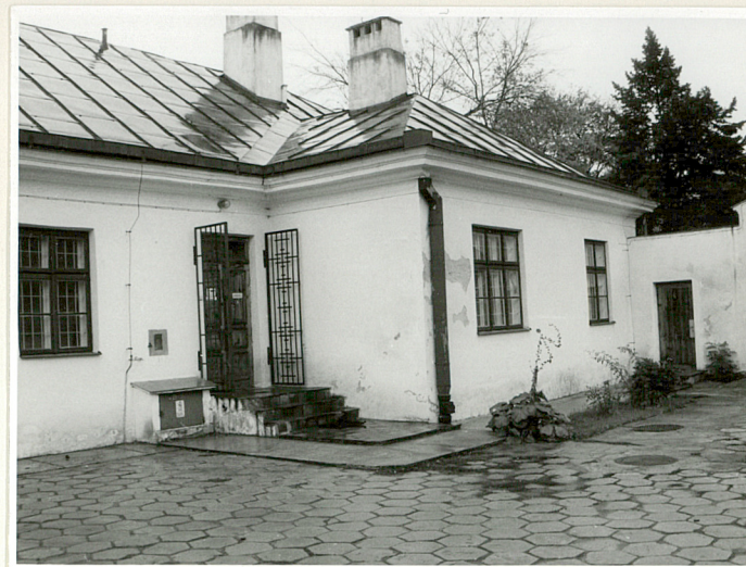
ryzalit widok od pd.