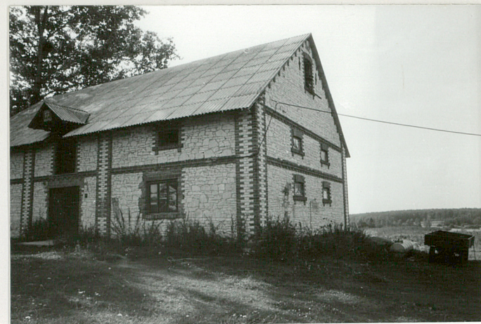
Elew. półn. i część wsch.