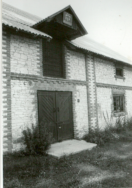
Otwory wejściowe w elew. wsch.