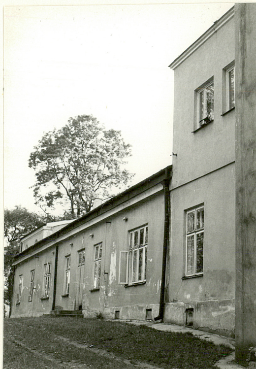
- Elewacja tylna, pn-wsch.