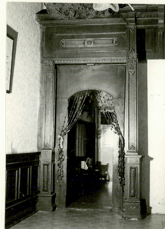
- Fragment wsch. sali parteru.