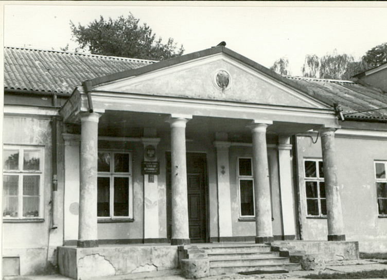
- Portal elewacji frontowej.