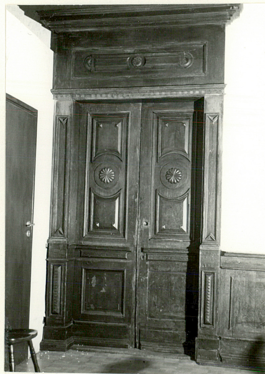
- Drzwi na korytarz z sali wsch. parteru.