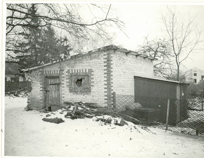
MAGAZYN - WIDOK OD PD.-ZACH.