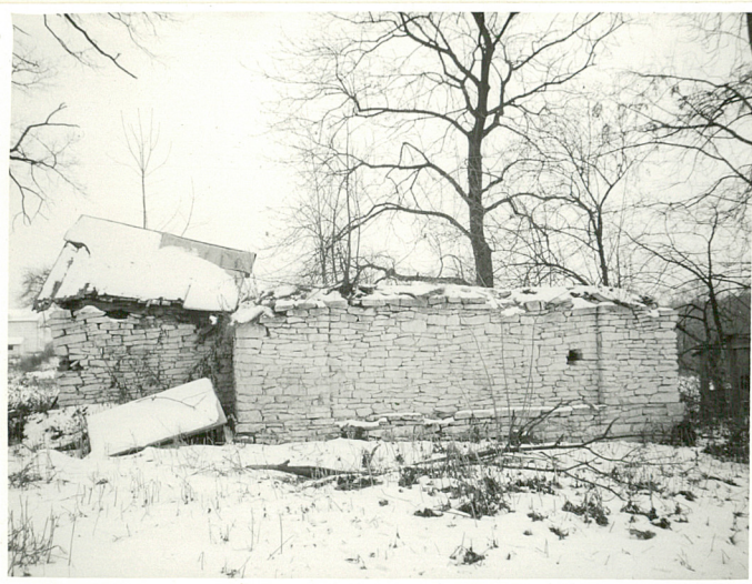
"LODOWNIA" PRZY KUCHNI DWORSKIEJ - WIDOK OD ZACH.