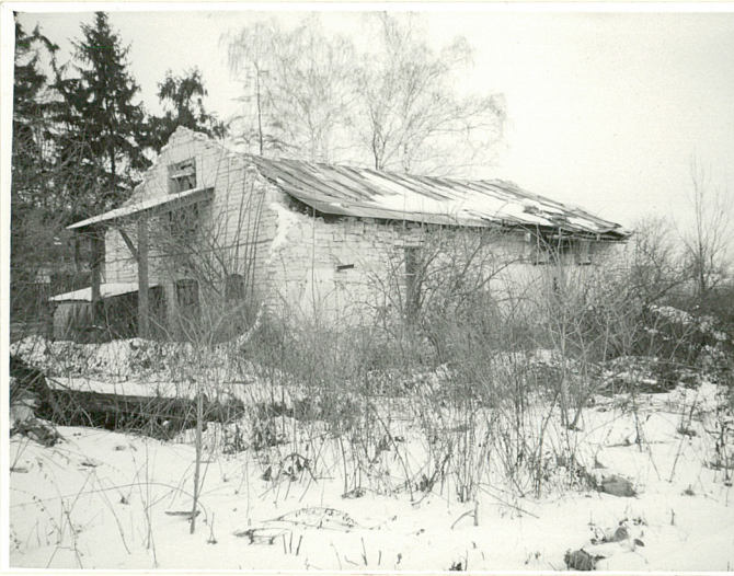
BUDYNEK GOSP. - WIDOK OD PD-ZACH.