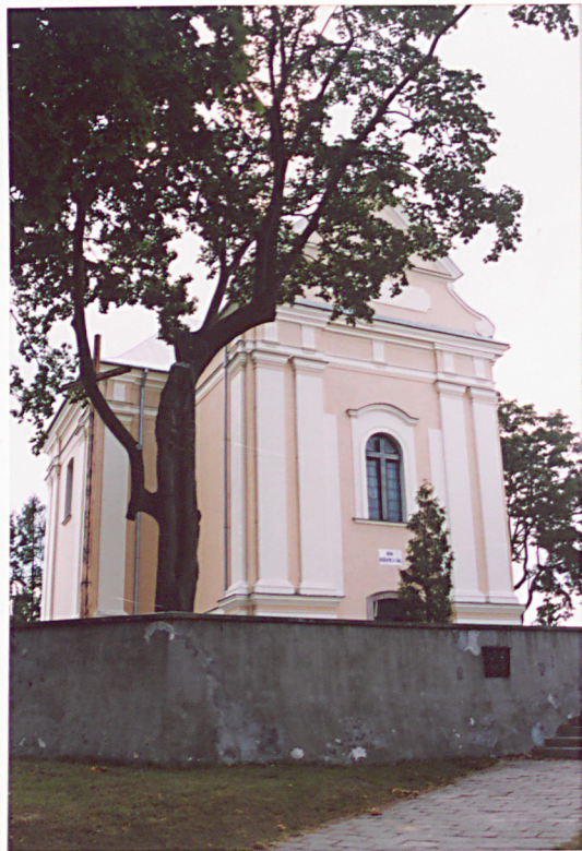
Widok na kościół od wsch.