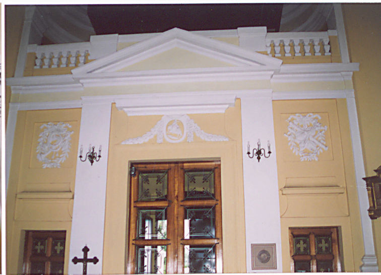
Klasycystyczna dekoracja chóru muzycznego