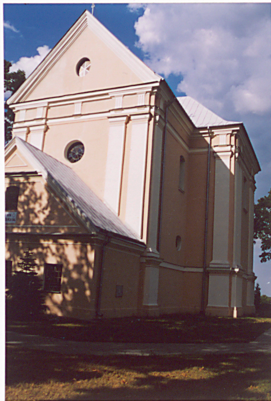
Widok na kościół od pd.