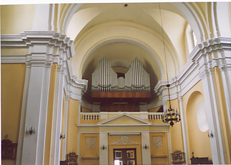
Widok na chór muzyczny