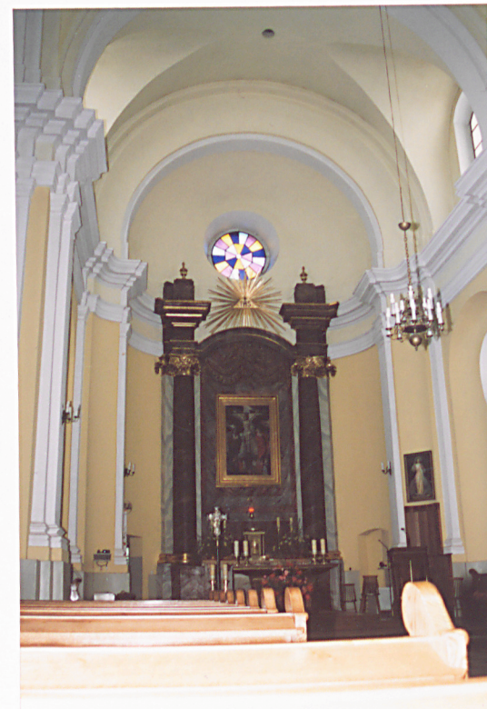
Widok na ołtarz główny