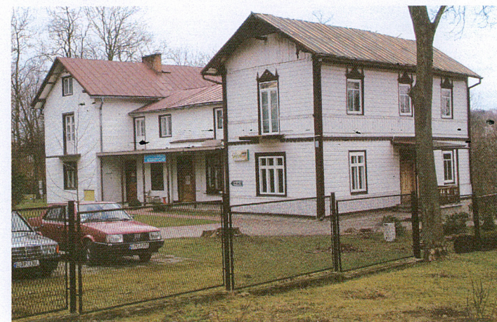
1. Widok od pd.-wsch.

Instalacje: Wodno-kanalizacyjna, elektryczna, c.o., gazowa, odgromowa.