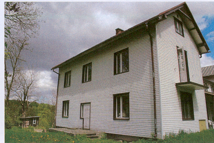
4. Elewacja boczna zach.