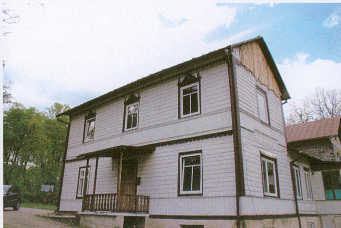
3. Elewacja boczna wsch.