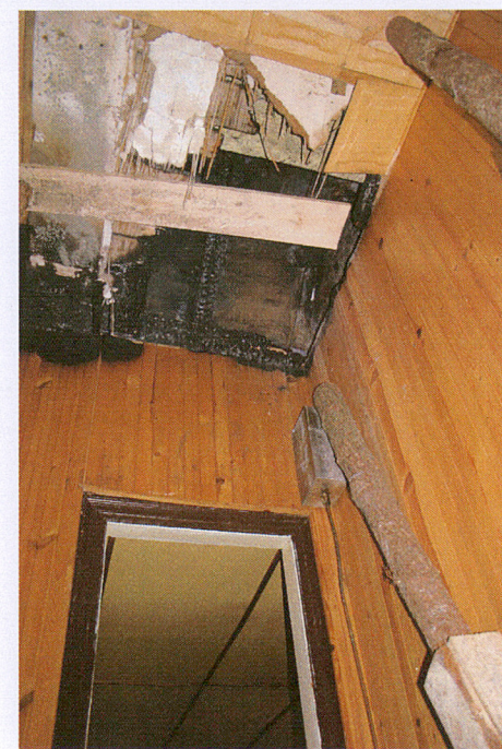
8. Fragment spalonego stropu