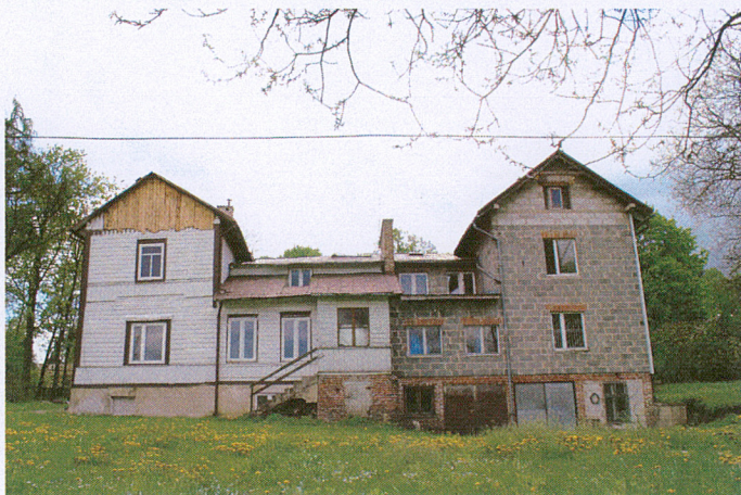
2. Elewacja tylna pn.