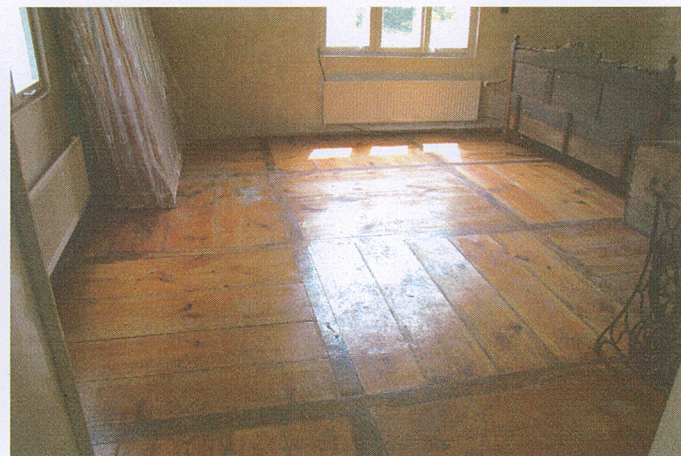
6. Parkiet w pomieszczeniu traktu frontowego