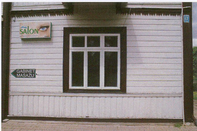
5. Okno w ryzalicy wsch. elewacji frontowej