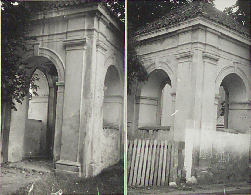
31. Szkic sytuacyjny, plan schematyczny, uwagi opisowe, fotoarafia