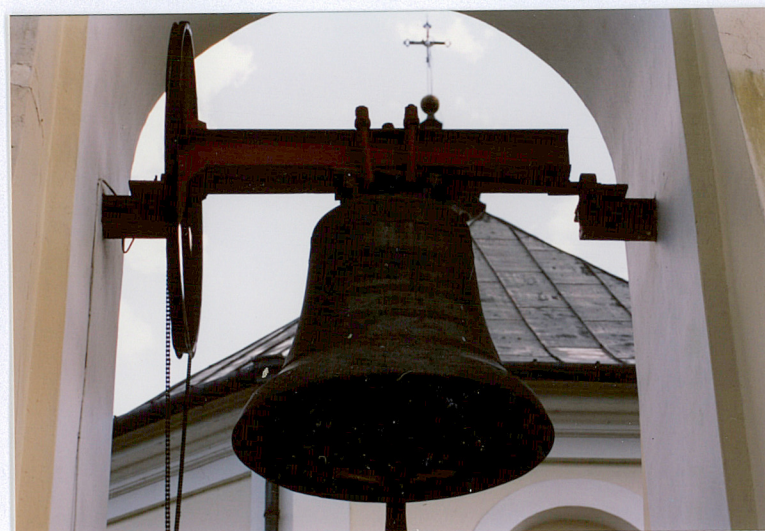
Widok na arkadę z dzwonem