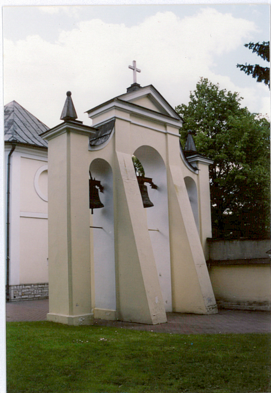
Widok od zach.