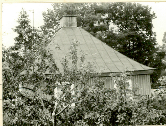
ELEW. PŁD. I WSCH.