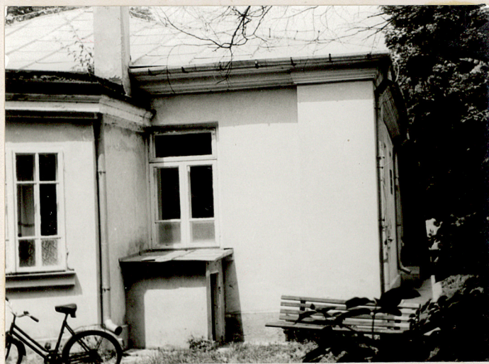
FRAG. ELEW. PŁD.