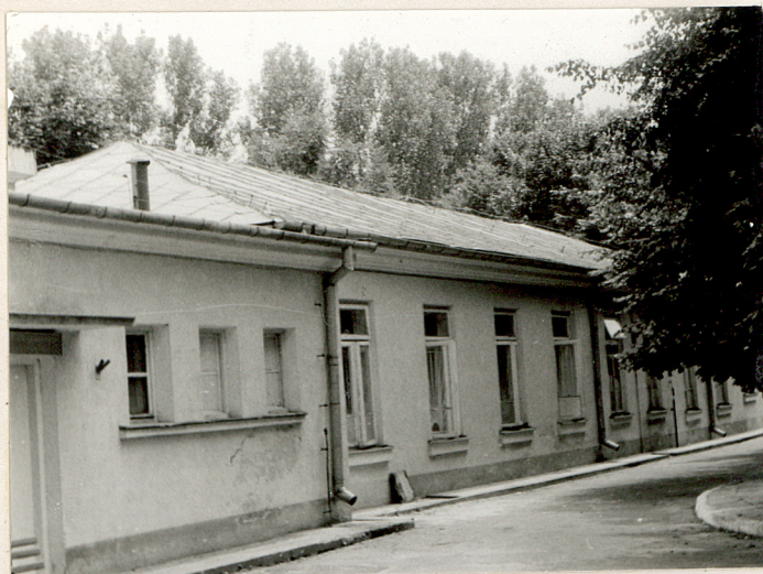
WIDOK OD ZACH.