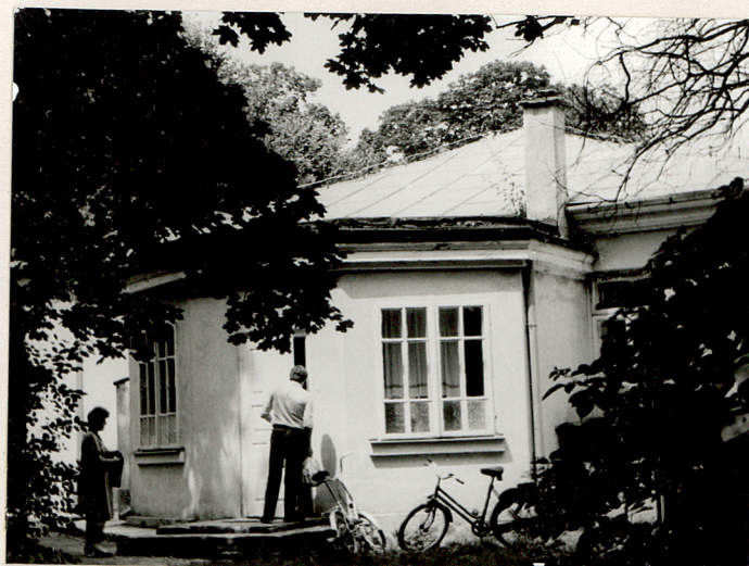
WIDOK OD PŁD.