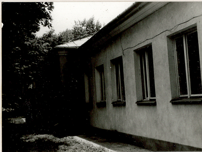
FRAG. ELEW. WSCH.