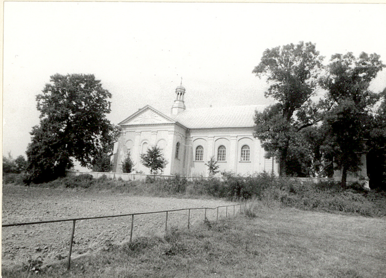
Widok od południa.

11. Zdjęcia, rzut, przekrój, sytuacja, orientacja