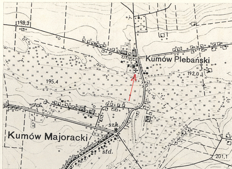
Skala 1:25 000