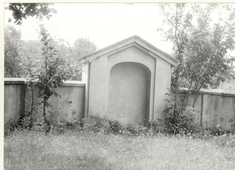
Kaplica w narożu ogrodzenia.