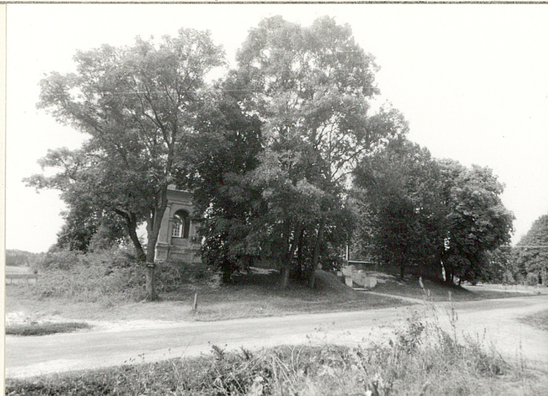
Widok od frontu /wsch./.

3. Zawartość wkładki (nazwa obiektu lub materiału uzupełniającego)