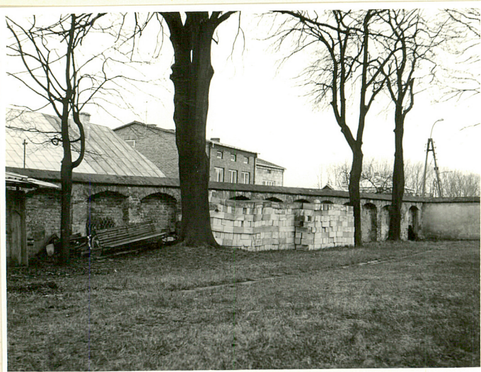
ogrodzenie od pd.