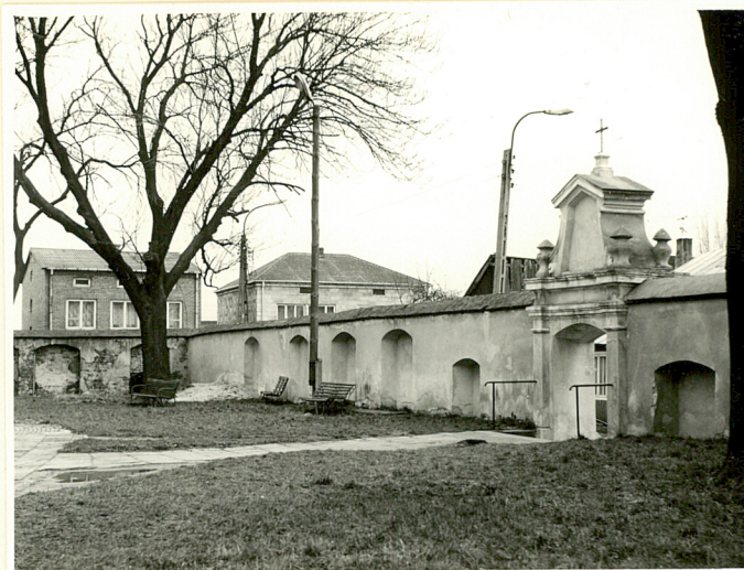
zach.ogrodzenie od strony fasady