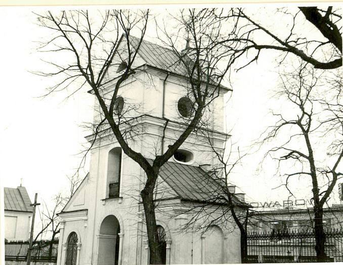
brama dzwonnica od pd.wsch.