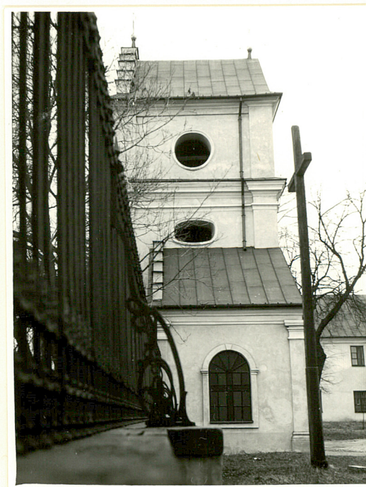
brama dzwonnica od zach.