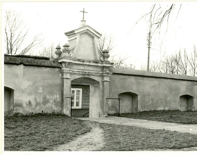
boczna brama w zach. części