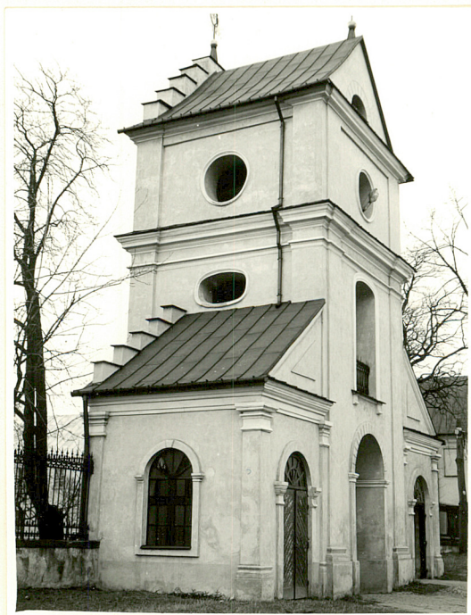
brama dzwonnica od pd.zach.