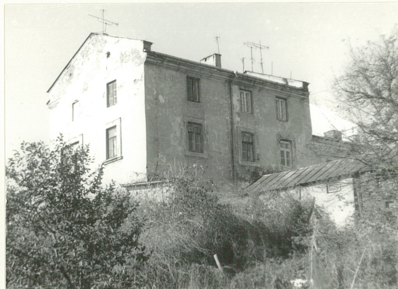
Fot.5 Pawilon wsch. (widok od pd.-wsch.)