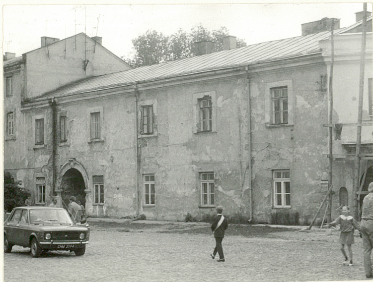
Fot.1 Część pn. skrzydła frontowego