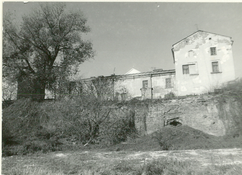
Fot.4 Widok od pd.-wsch.