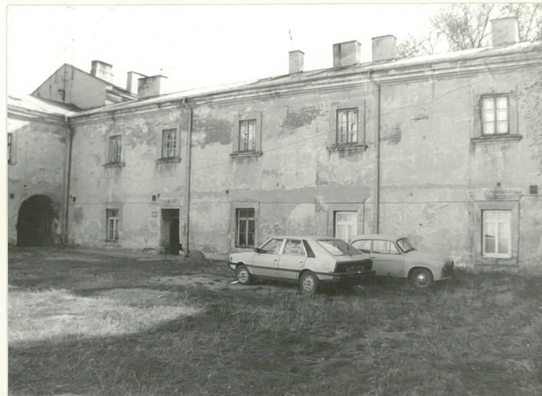
Fot.8 Dziedziniec - skrzydło pd.-wsch.