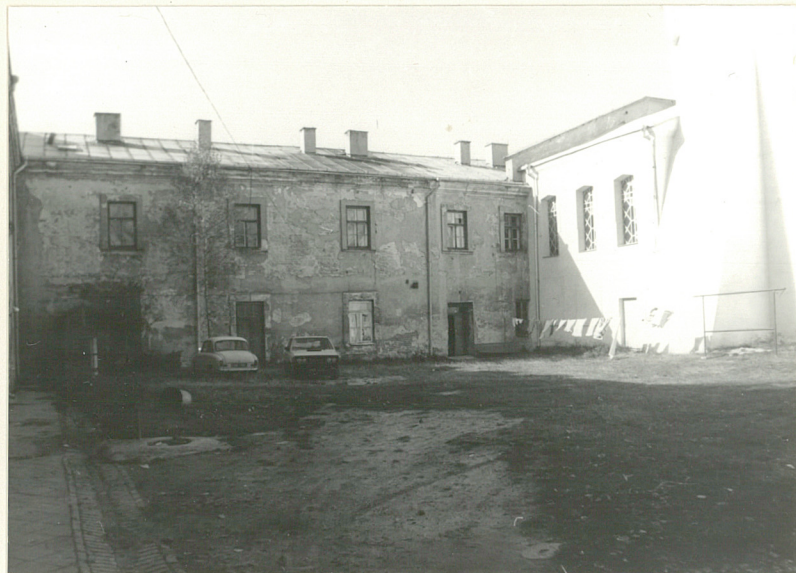
Fot.7 Dziedziniec - skrzydło pd-zach.