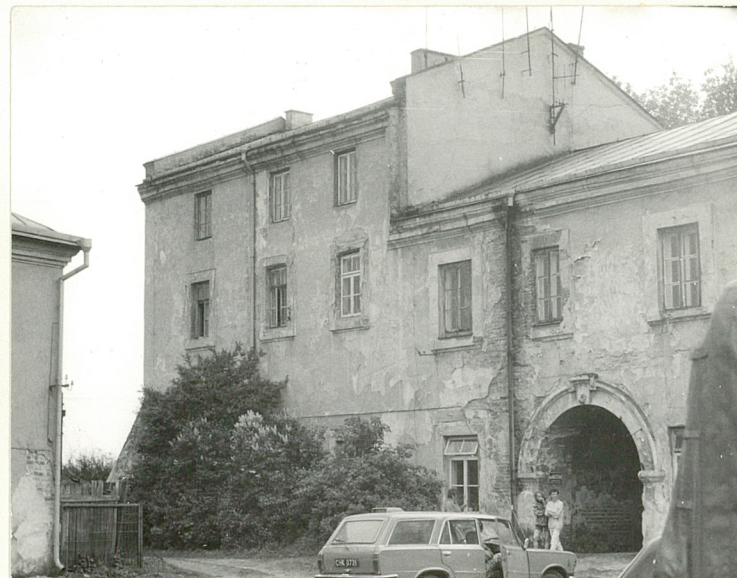
Fot.2 Część pd. skrzydła frontowego