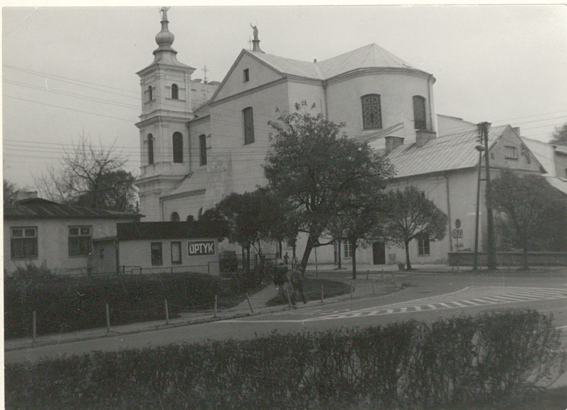
Fot.1 Widok od półn.-zach.