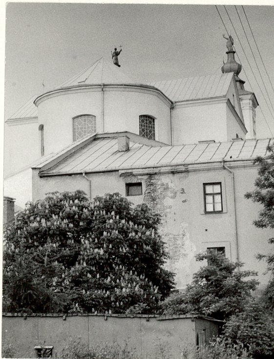
Fot.2 Widok od poł.