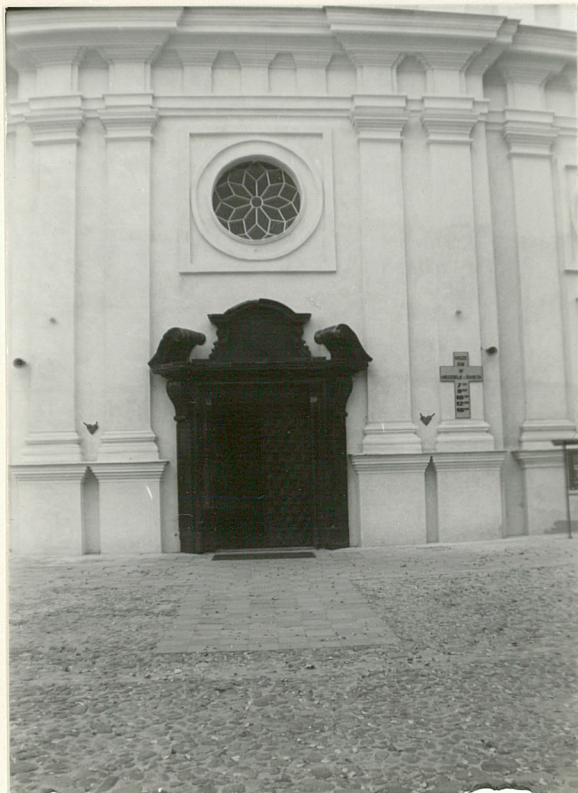
Fot.4 Portal główny z czarnego marmuru w fasadzie kościoła