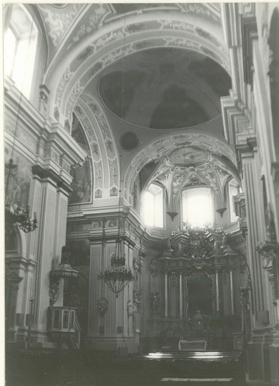
Fot.5 Wnętrze- widok w stronę prezbiterium