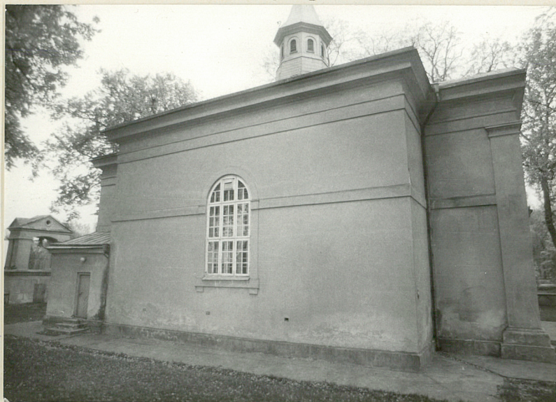
Fot.3 Elewacja pn.-zach.