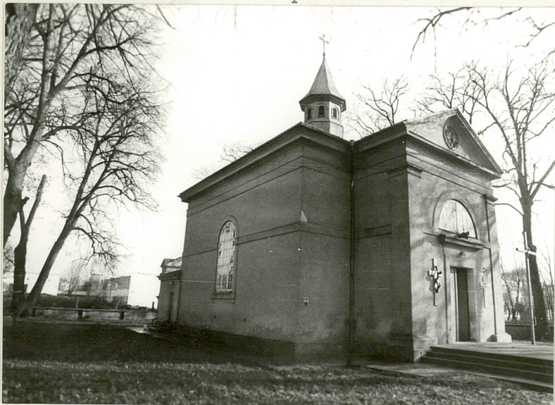
Fot.1 Widok od pd.-zach.