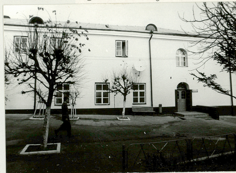
Fot.2 Fragment elewacji wsch.