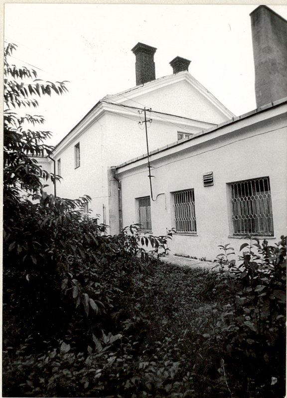
Fot.4 Widok od pn.-zach.