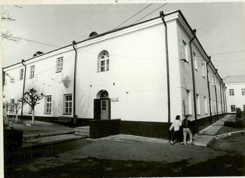
Fot.1 Widok od pd.-wsch.