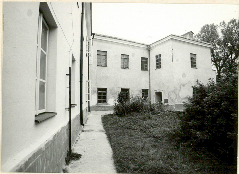
Fot.3 Widok na elewację pd.-wsch. /z d.kaplicą/ na lewo - skrzydło klasztoru.