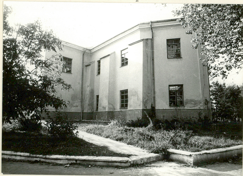
Fot.1 Widok od pd.-wsch.