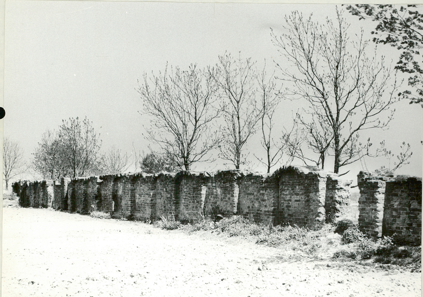
Fot.4. Fragment starych murów okalających kościół katedralny