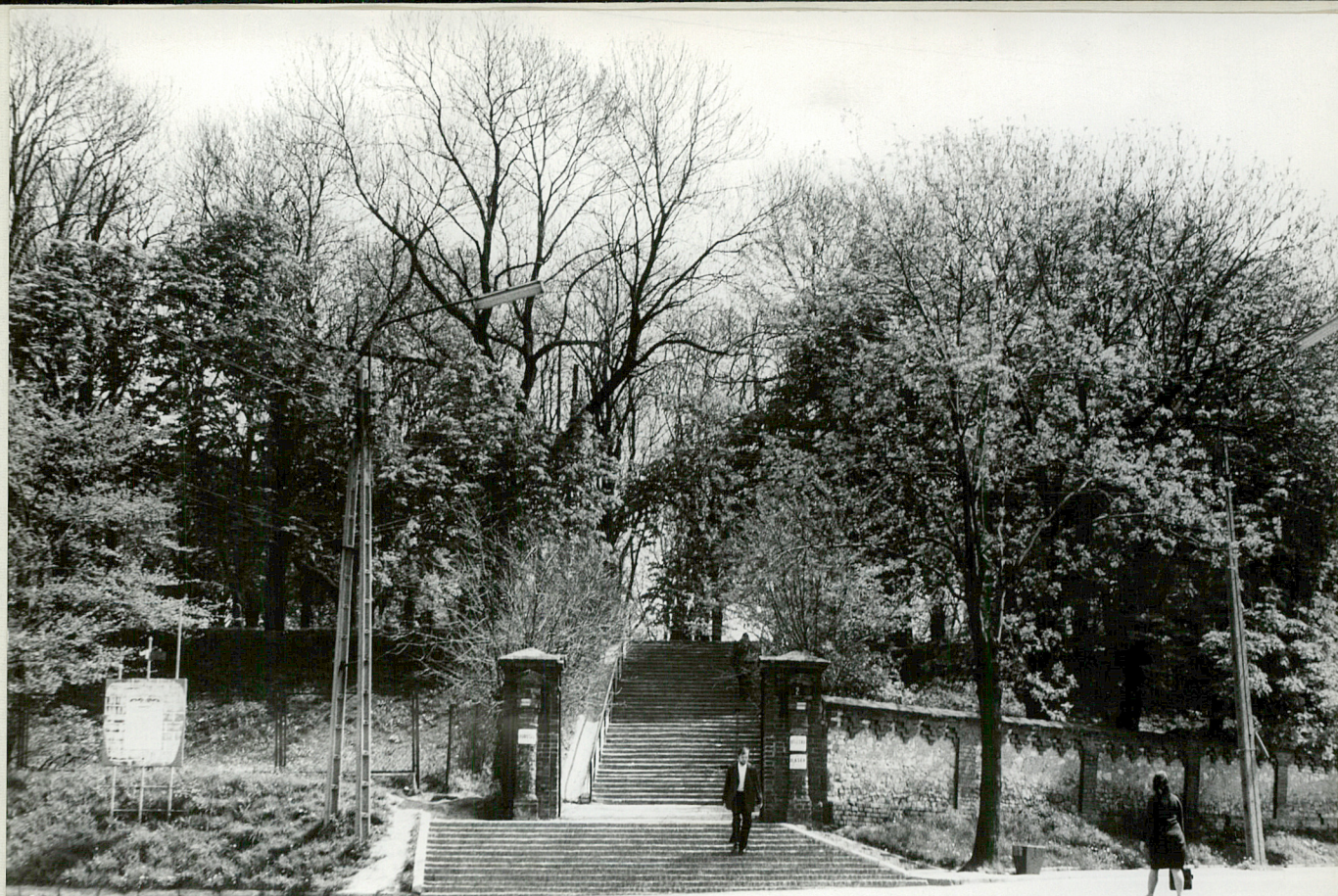
Fot. 1. Wejście główne do parku od ul. Lubelskiej