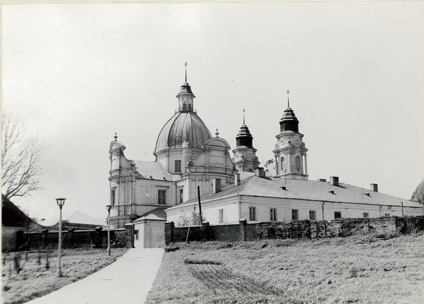
Fot. 7. Wejście do katedry od strony nowozałożonego parku miejskiego