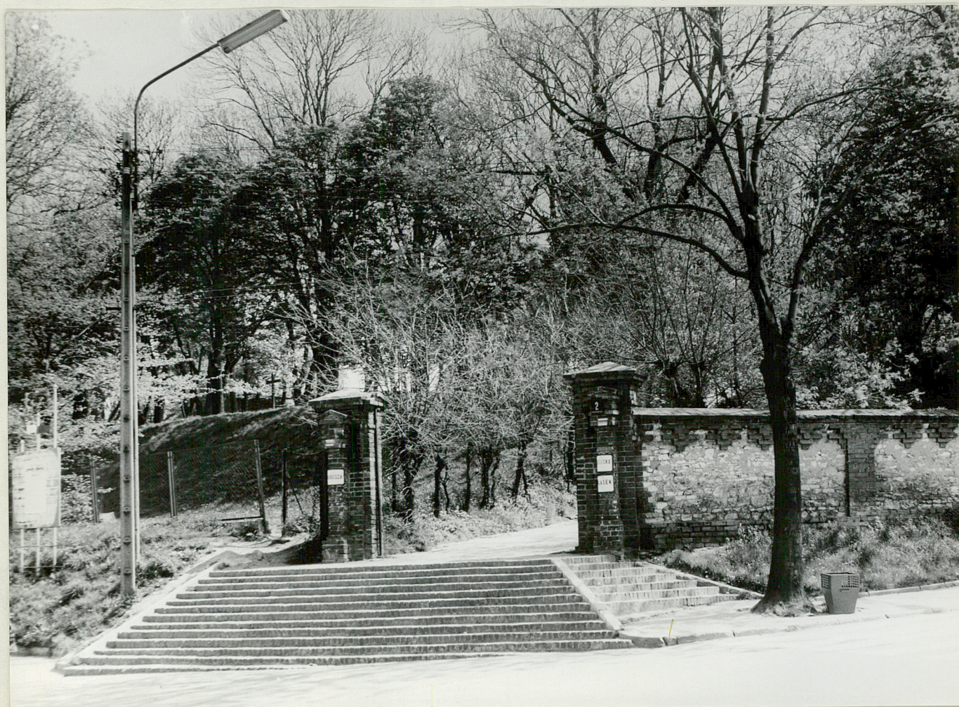
Fot. 2. Boczny widok głównego wejścia do parku od ul. Lubelskiej