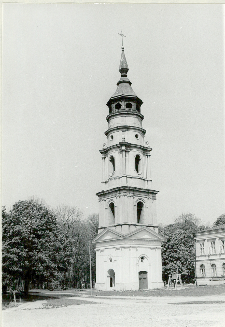
5. Fot. Dzwonnica kościoła katedralnego