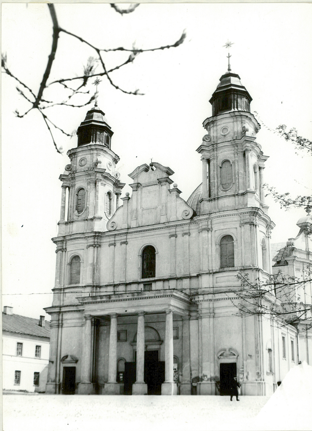
Fot. 6. Frontowa część kościoła katedralnego