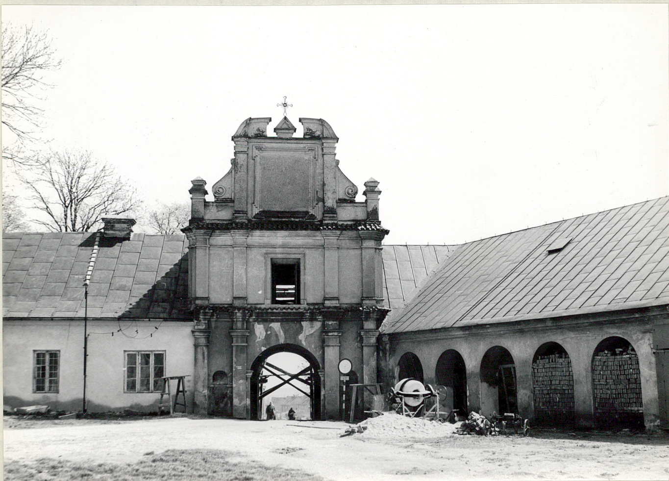
Fot. 8. Brama wejściowa do katedry od strony podwórza kościelnego