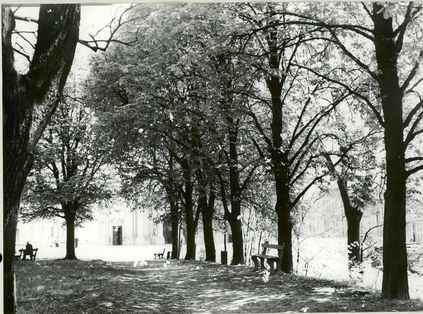
Fot.3. Fragment alei kasztanowcowej