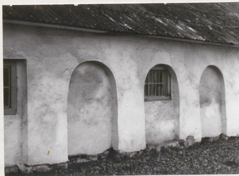
Elew. wsch. - fragm.