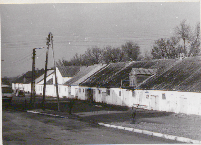
Widok od pd.-zach.