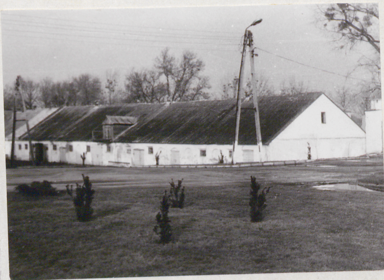
Widok od pd.-zach.