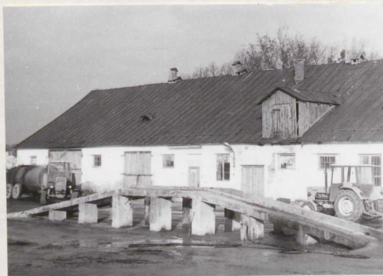
Elew. zach. - fragm.