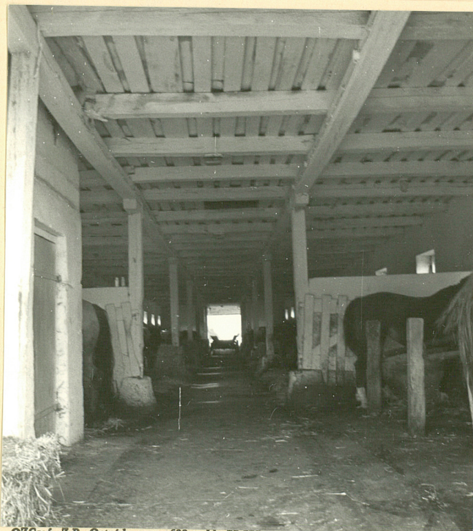
OZGraf. Z.P. Ostróda zam. 699 nakł. 23.690