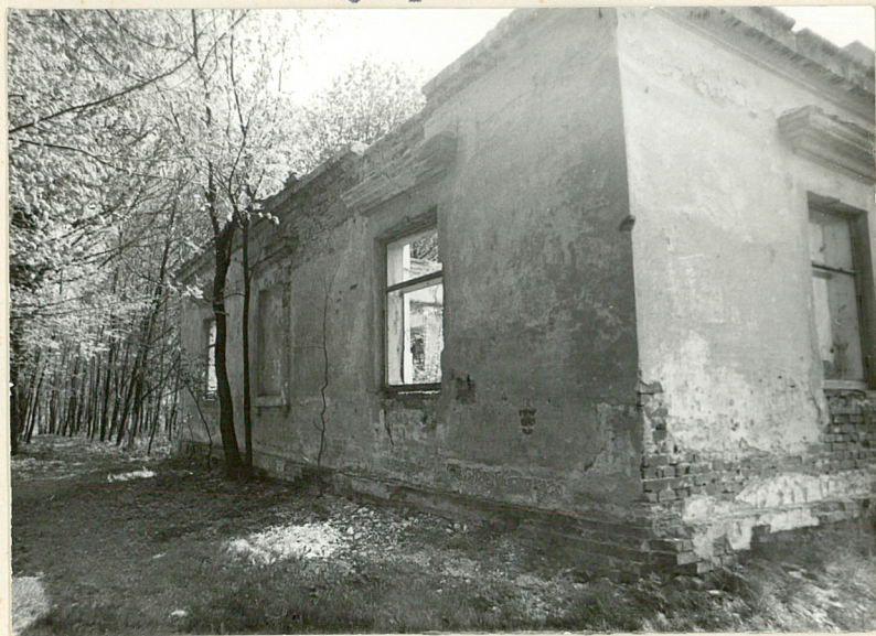
Fot.4 Elewacja pn.