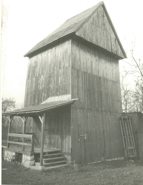
Widok od pn.-wsch.