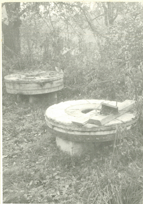
Kamienie ze złożenia