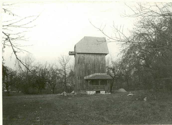
Widok od wschodu z drogi

Wkładkę założył: Janina Petera, 1997 (imię, nazwisko, data)