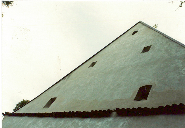
szczyt w elewacji bocznej