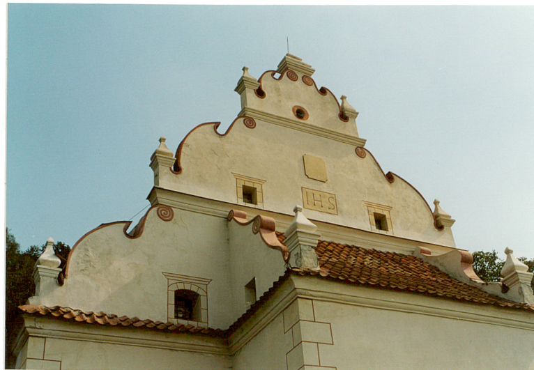
szczyt w elewacji frontowej