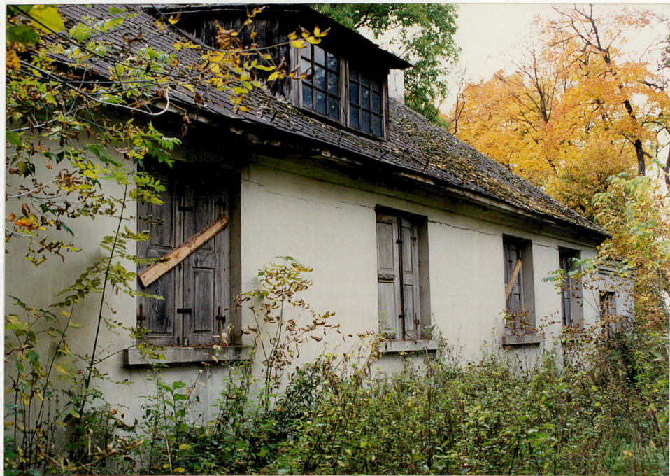
WOROBLIN Zesp. dworski