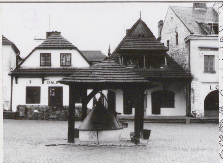
Widok od pn-zach.