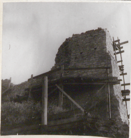
B. Tondos, J. Tur 1974, 1977 zbiór własny