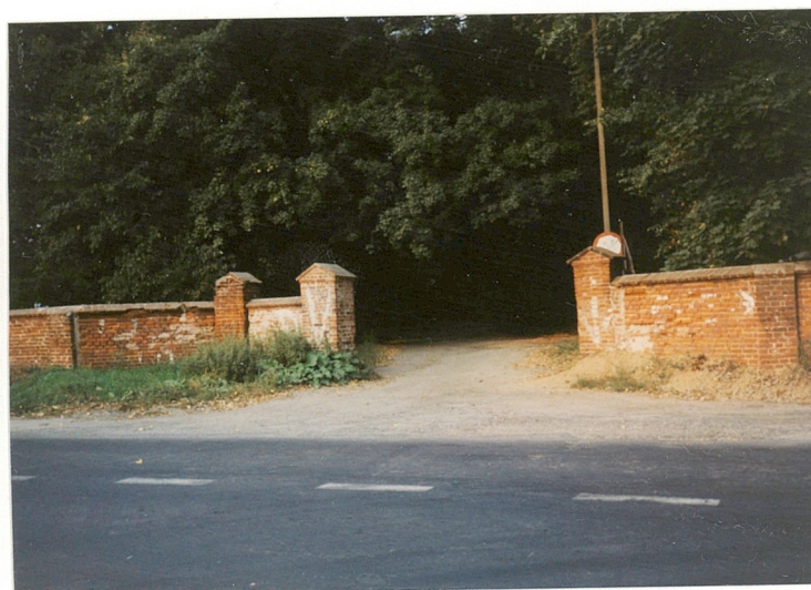
BRAMA NR. 8