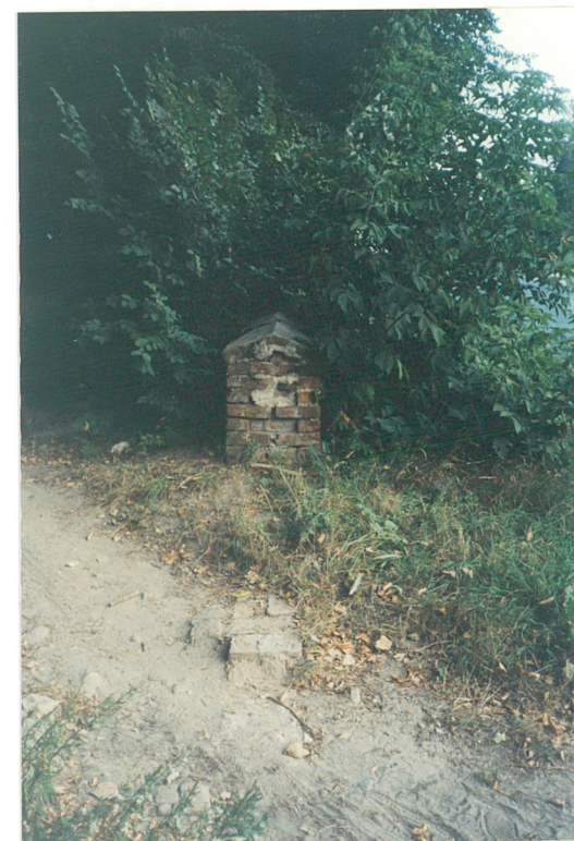
PÓŁNOCNY FRAG. MURU A