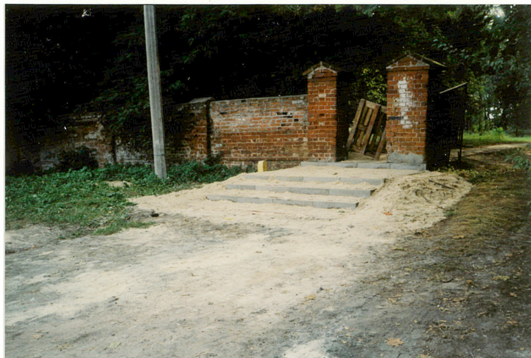
BRAMA NR. 9