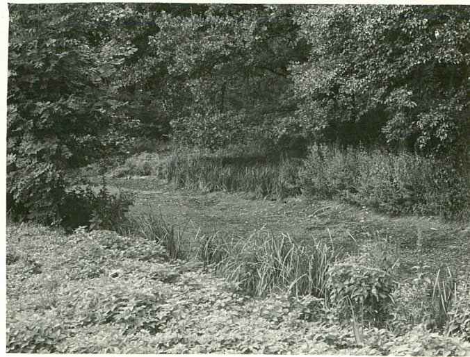
3 d.staw parkowy