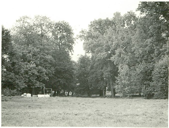
2. fragm. parku