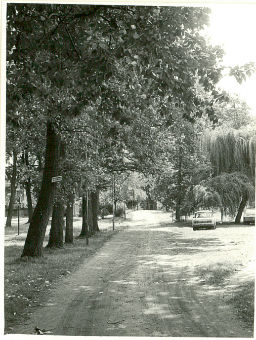
5. aleja dojazdowa