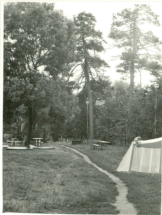
4. fragm. parku