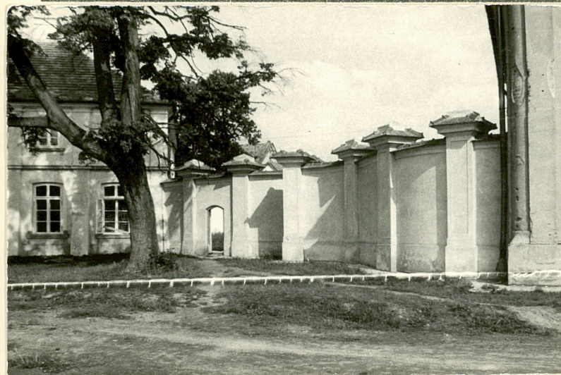
Mur między kordegardą pn. a oficyną pn.

10. Rejestr zabytków A 457 16.VI.1970 Nr data