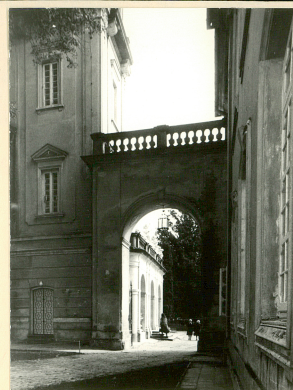
Mur z bramą między Pałacem a Teatralnią.