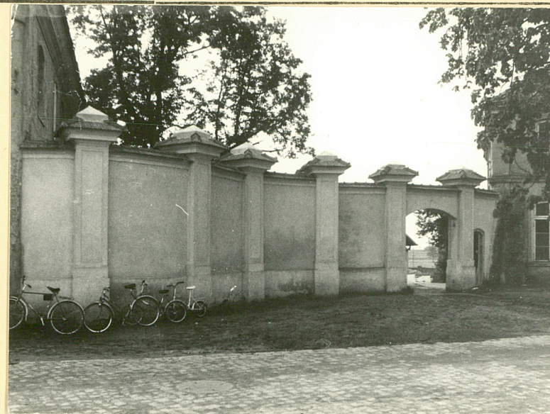
Mur między kordegardą a oficyną pd. Wid. od pn.