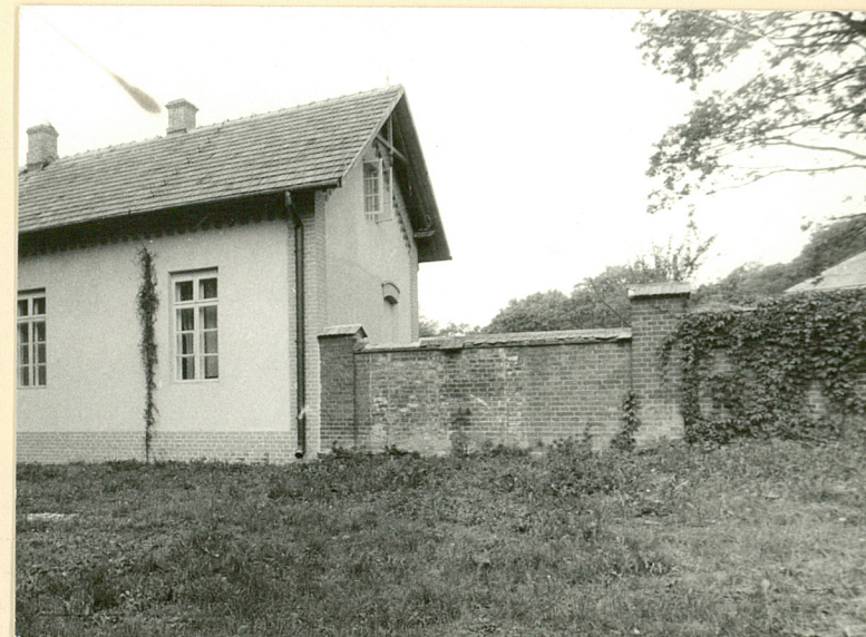
Mur oddzielający park. Część pd. Wid. od zach.