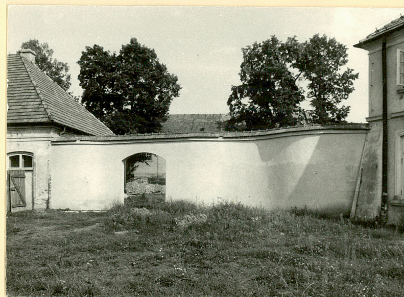
Mur między wozownią a kordegardą pn. Wid. od pn.

Przemysław Maliszewski, październik 1987