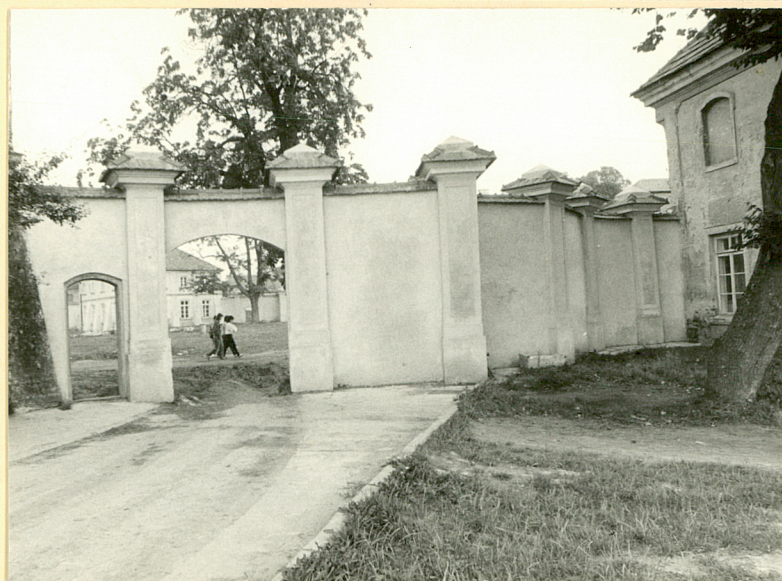
Mur między oficyną a kordegardą pd. Wid. od pd.