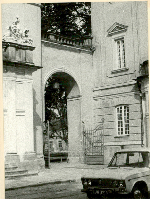
mur z bramą między pałacem a teatralnią. Wid. od wsch