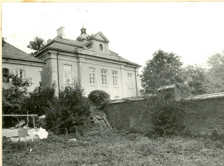
Mur oddzielający park. Część pn.