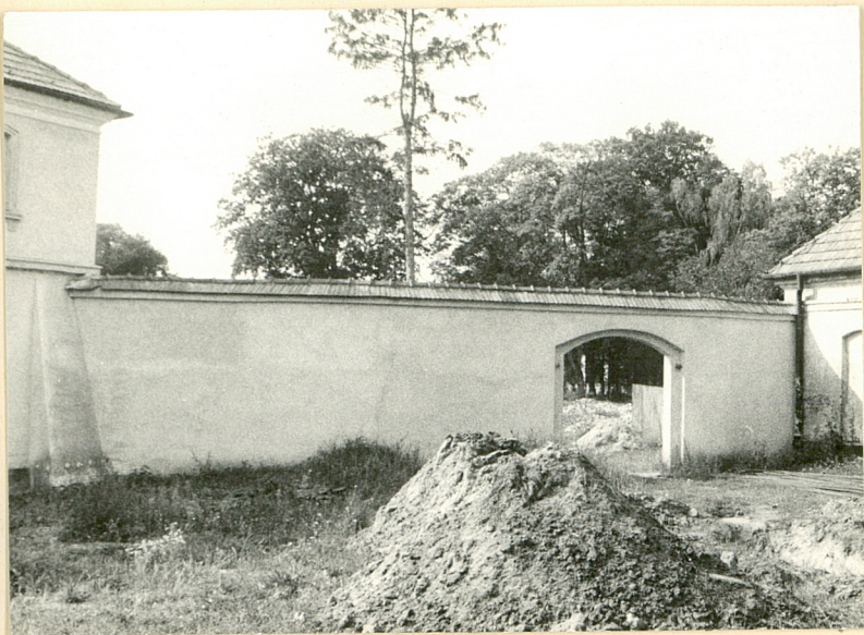
Mur między Teatralnią a oficyną pd. —→