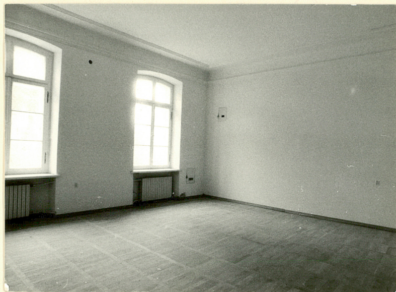
I piętro. Fragment wnętrza