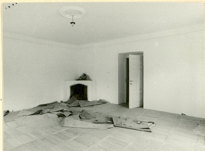
Parter. Fragment wnętrza