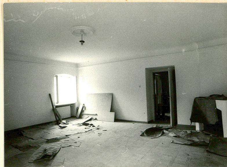
Parter. Fragment wnętrza