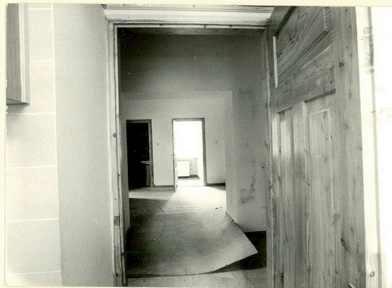
I piętro. Fragment wnętrza