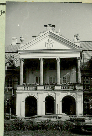
36. Wypełnił dnia