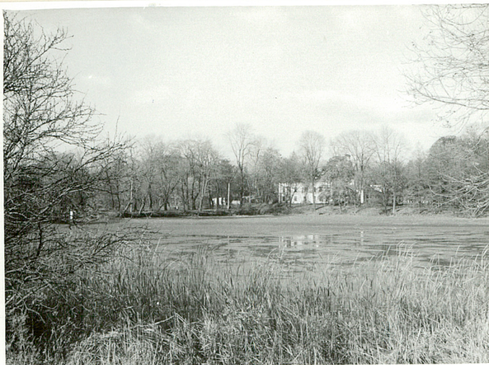
fot.4 Cz. pałacowa, widok od pd.