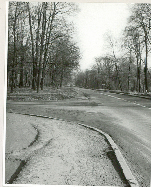
fot.15 Droga Lublin-Warszawa, widok o od zach.