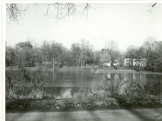
fot.3 Cz. rezydencjonalna, widok od str. pd.