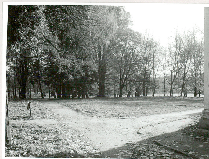
fot.11 Szpaler grabowy wzdłuż stawu "Irena"