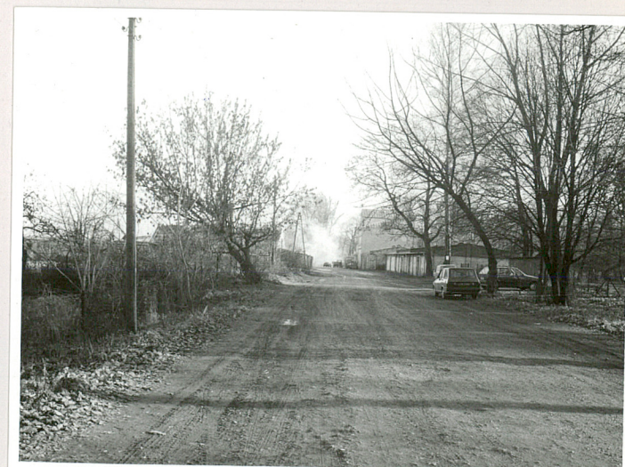
fot.16 Droga przez teren d. folwarku