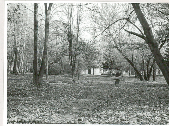
fot.12 Wnętrze parkowe z tyłu pałacu