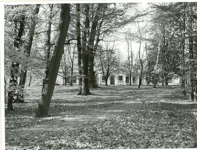
fot.9 Fragment parku, widok od wsch.