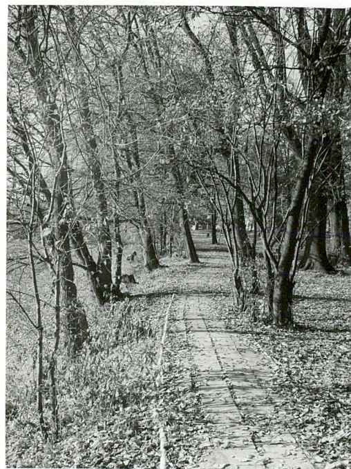
fot.10 Ścieżka przed pałacem od str. zach.