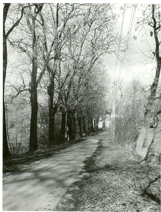
fot.7 Gł. wjazd do pałacu grobłą od str. pd.