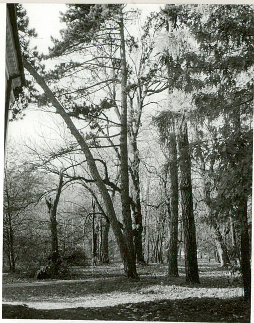
fot.13 Sosny wejmutki przed frontem pałacu