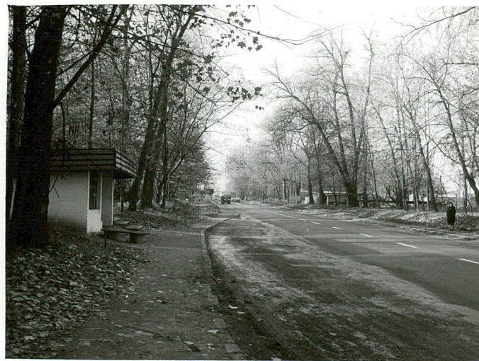
fot.2 Główna oś zespołu, /droga Lublin-Warszawa/