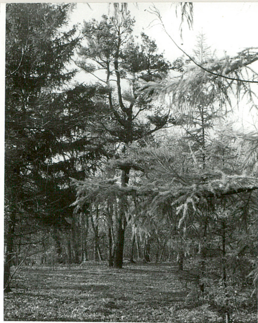
fot.14 Widok cz. zach. parku