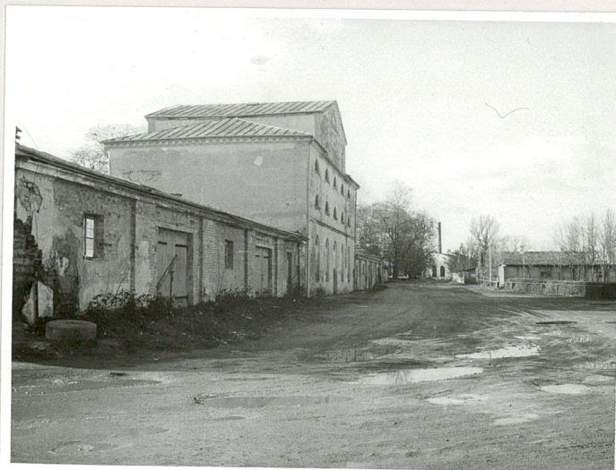
fot.17 D. folwark, widoczny śpichlerz, ob. młyn