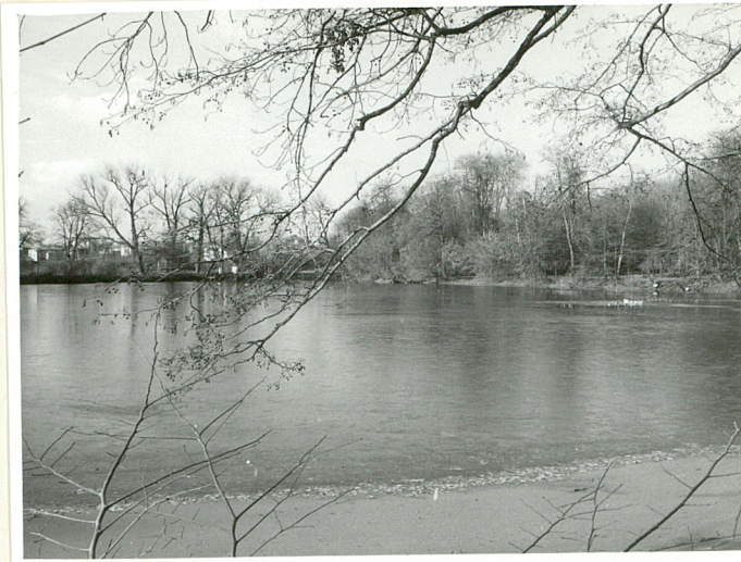
fot.6 Staw "IRENA", widok od grobli