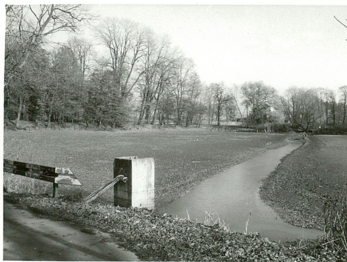
fot.8 Staw "Pod pałacem/