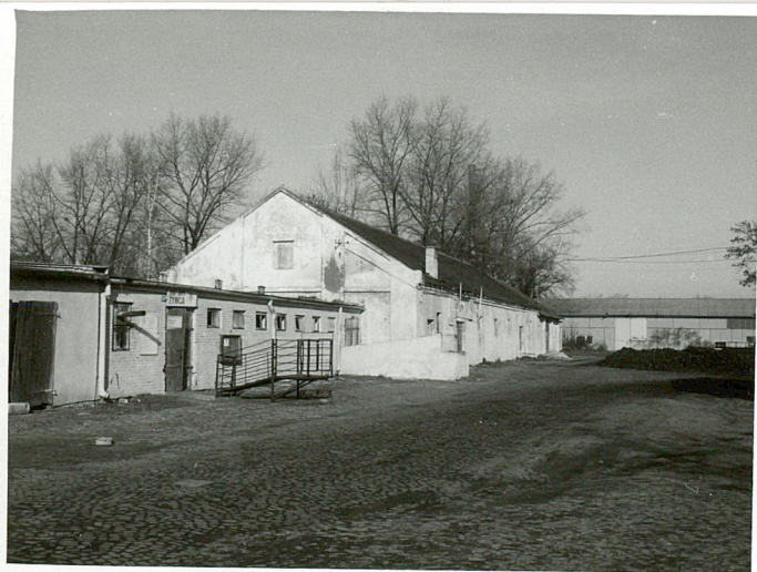
fot.18 Fragm. d. folwarku