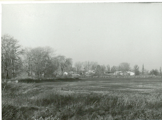
fot.1 D.zespół folwarczny widok od str. wsch.

c.d. pkt 12. Od 1923 r. Garbów dziedziczą dzieci B.Broniewskiego: Zygmunt, Mieczysław, Zofia i Krystyna. Od 1945 r. całość stanowi własność Skarbu Państwa. W l.1948-50 zespół pałacowo-parkowy przedzielono nowowytbudowaną drogą Lublin-Warszawa, zmniejszając o 30% jeden ze stawów. W 1960 r. w części płn. wybudowano pawilony handlowe i gastronomiczne oraz kilka nowych budynków gospodarczych na terenie d.folwarku w płn. części założenia. Po 1945 r. pałac użytkowany jest ciągle jako Ośrodek Zdrowia, stawy są własnością Państwowego Gospodarstwa Rybnego w Garbowie. Budynki gospodarcze w części płn. w tym młyn /d.śpichlerz/ dzierżawione są prywatnym użytkownikom. Gorzelnia obecnie użytkowana jest przez Spółkę Akcyjną "Golub" z Lublina.