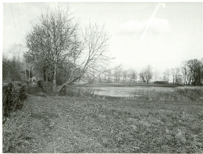
fot.5 Staw "Kępa większa"